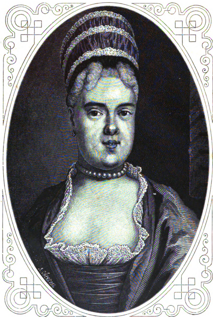
НАТАЛЬЯ ФЕДОРОВНА ЛОПУХИНА.