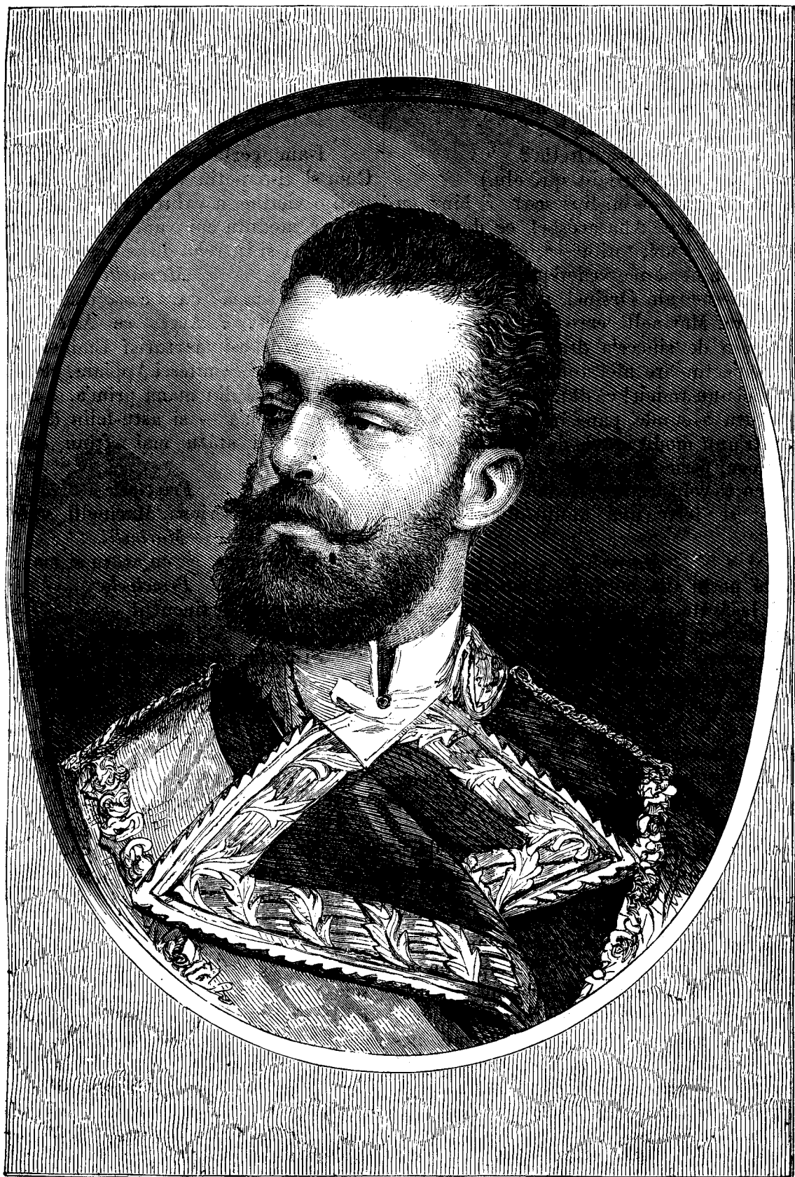
Amadeo, ex-regele Spaniei.