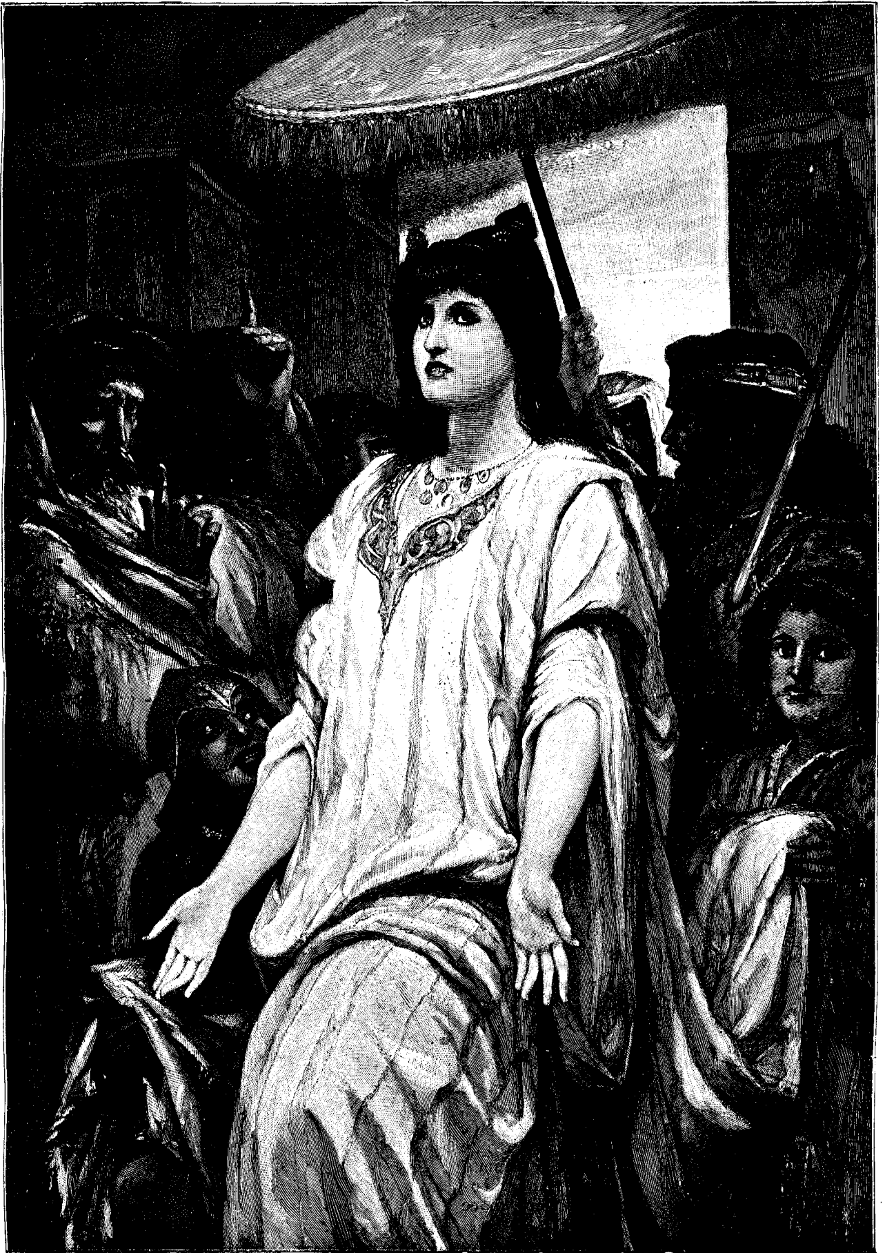
C L E O P A T R A.