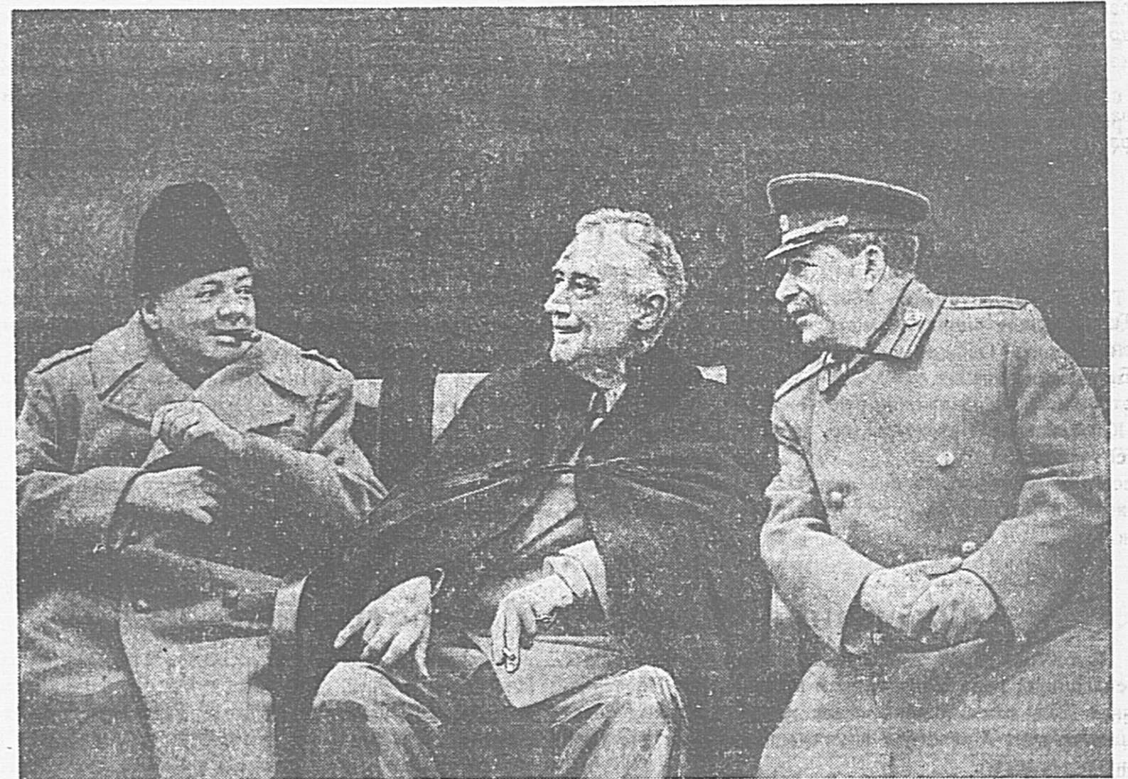
На Конференции руководителей трёх союзных держав — Советского Союза, Соединённых Штатов Америки и Великобритании в Крыму. На снимке: г-н У. ЧЕРЧИЛЛЬ, г-н Ф. Д. РУЗВЕЛЬТ и И. В. СТАЛИН.