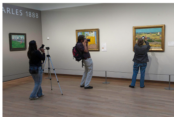
Volunteers digitising in Amsterdam (Van Gogh Museum)

I am writing to you from Wikimedia, a global movement whose mission is to make knowledge accessible for everyone online. We believe that our cultural heritage needs to be digitised in order to be preserved and enjoyed by all Europeans. We will be directly affected by the decision you make on Article 5 of the Copyright in the Digital Single Market proposal.