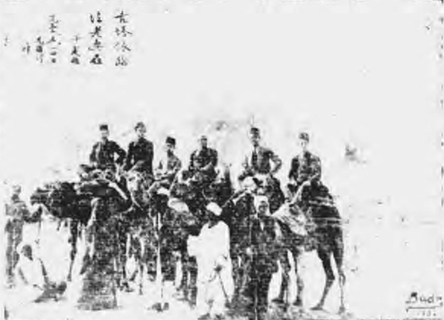
中國留埃學生在金塔前攝影

十分隔膜。堅等抵開羅之次日。大教長親來拜訪。名人學士新聞記者。遂接踵而至。幾有應接不暇之勢。報章雜誌。多登載堅等照片。及沙儒誠先生關於中國伊斯蘭之談話。講演。於是中國學生團之名。傳遍全國。一般始知中國有五千萬教胞。有無數之回教學校。與禮拜堂。且在中央政府各省市政府各機關各學校任職之回教人物。與夫十餘種之回教刊物。聞者莫不稱慶。此次中日事件。通俗人亦表同情於我。問之。則曰。以中國有五千萬教胞也。沙先生由左公之介紹。得以中國學生團領袖之名譽。親見埃王傳德一世。致謝容納中國學生之特典。並為中國五千萬教胞向埃王致意。埃王優禮有加。且允許竭力扶助中國回教教育之發展。以後要求增加學生名額。必能成功也。堅每日除讀書看報造飯洗衣禮拜外。閒至朋友家練習阿刺伯會話。生活頗為安適。開羅氣候溫和。空氣乾燥。最適於健