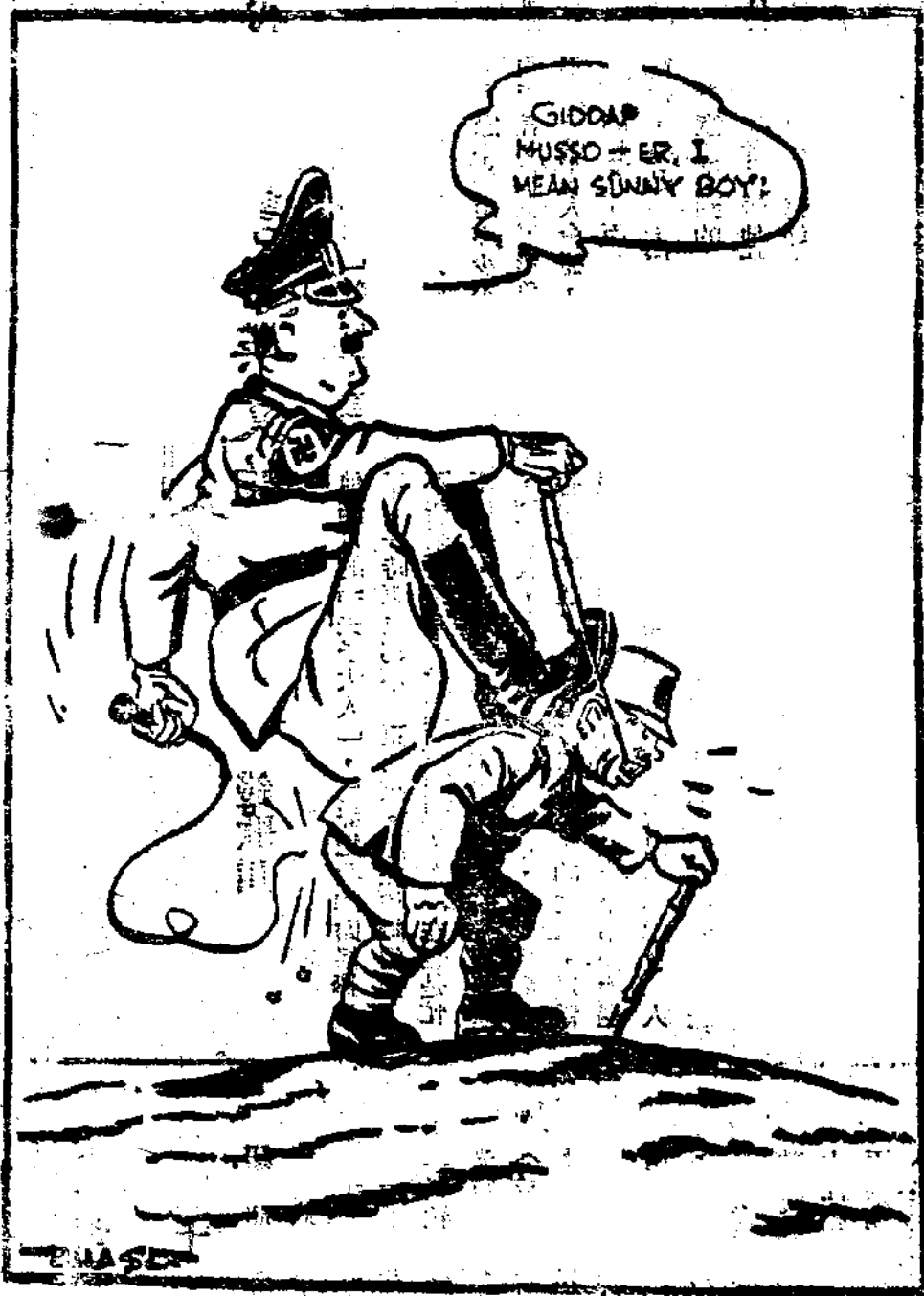
盲人騎瞎馬 夜半臨深池