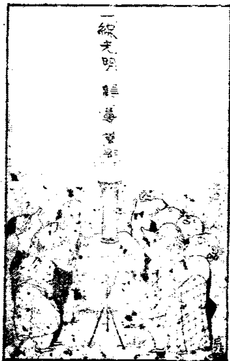
一級光明 維多利亞

總之：國際關係，錯綜複雜，各國主持國家大計者，每遇一件大事，恆於各種關係中，權其輕重利害而爲最後的決定。在未決定之前，局中人，亦往往不自知，局外人更不能預下斷語，不過僅就目前已發生的事實，推論其大概耳。 七月十六日