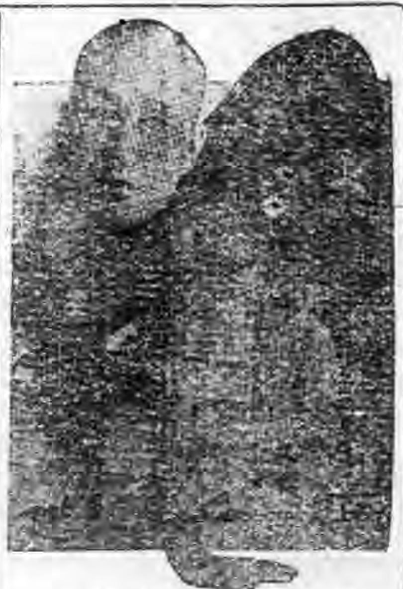
這是偽杭州市長何瓚的像片，她甘願替敵人作走狗，結果狗命送掉。她是一切漢奸走狗的好榜樣。(易騰)