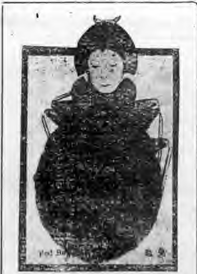
據說這是何狗的日本老婆，她負到晚間，與一犬可住何狗不敵。但在何狗巧到那天，她恰巧去積善坊巷，是替何狗關門的。原作的何狗，雖已也。

當何狗受屠的消息傳佈了，我們在後方的人聽見以後，真是痛快之至，但是當初只聽到他傷了而沒有死，每個的心中也都有無限缺憾似的，直到他斃命的消息證實後，我們才高歡呼。並以十二萬分誠懇的祝禱着，爲民除奸的四個愛國青年的安全與健康！ (完)