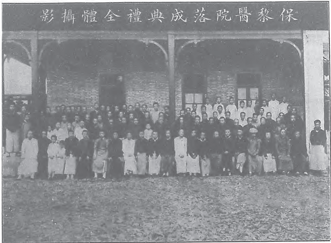
影攝賓來禮典成落院醫黎保