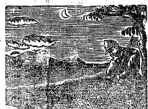
夕陽無限好，只是近黃昏！