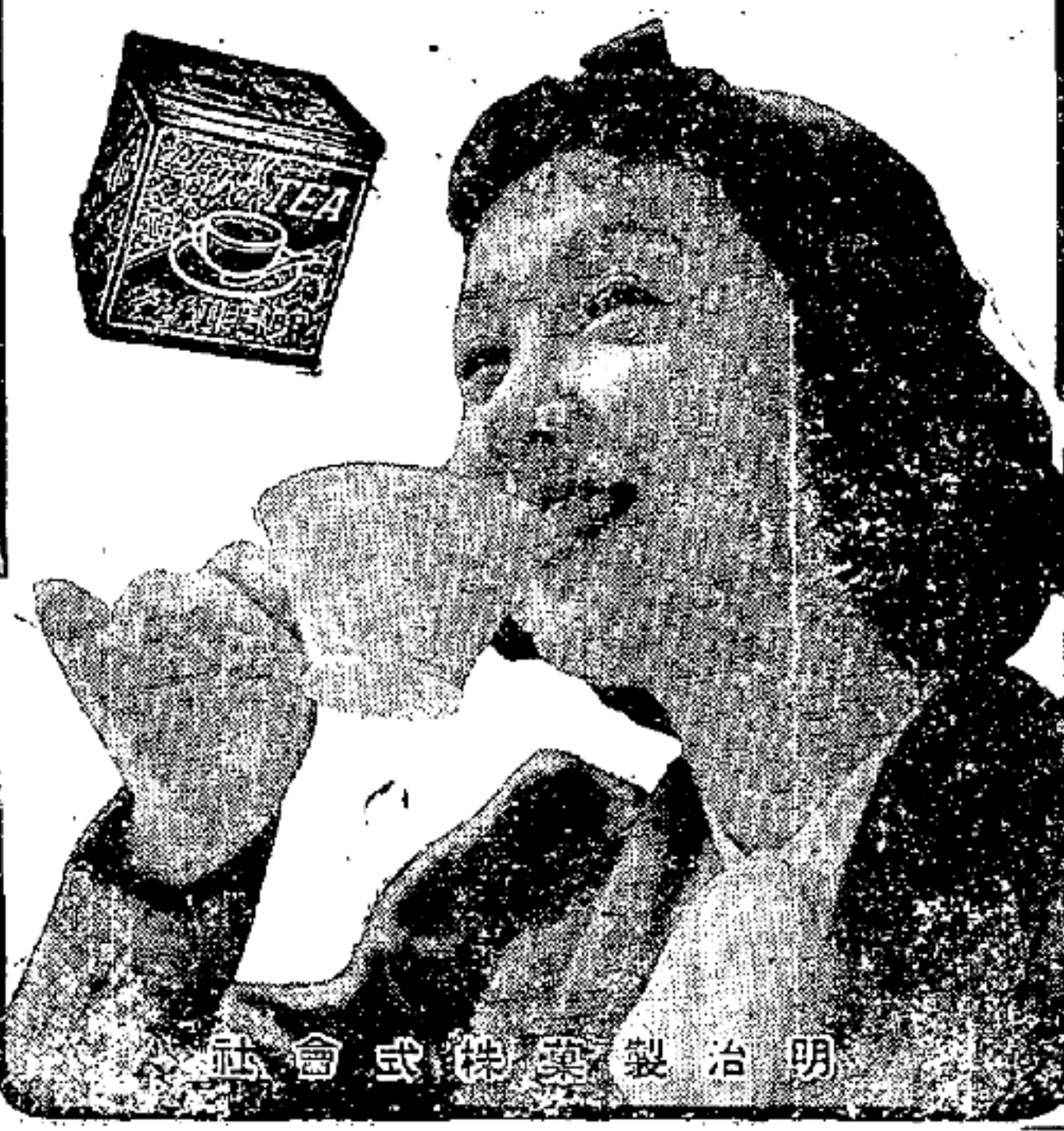
明治製菓株式會社