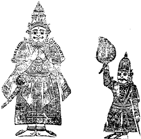
దశరథమహారాజు వేషం రావటం!

సుసు తుడసు సుప్రసిద్ధనామూడ క్షీనుంతుడను నేవివిరా నానుంతా దులు క్షీనుంతుడని విద్యావంతుడని సనుయందుమా ||సు||౧|| ధరాధరంబుల డరంధరుడనై పరంజరిలగా జేతునూ - సురాసుగల మక్కరా వాలమున మొరాలిడంగు జేతును ||సు||౨|| సనాసోక మత్కరంబులచె శంబరాడం లక పోరింగొంటినీ ధరావరానామకుల్ సనుగని సరెసరేయాన వింట్టి ||సు||౩|| ధరకనూతన పురిన్నేలు శ్రీధిరుకోదలంచెటి క్షీడక మర్కమర్కీ శ్రీకరంబులగు బహువరంబులొందె విచారుడక ||సు||౪||