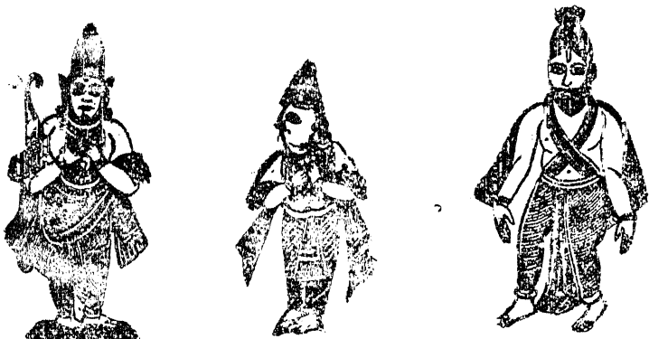
వశిష్ఠుడు. రాముడు. లక్ష్మణుడు రావటం.

వ॥ వ॥ దేవ దశరథ భూధవా యీడింభకులను సర్వవిద్యా పరిపూర్ణ పండితులుగా గావించెద.