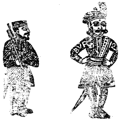
సుమంతు. పరిభానిగావటం! తురకమాటలు.

కా॥ కుసీయయా... సూర్యకులనుభూషకుల్ ధారక భృశాను మోదకుల్ : భానిశాధి నాయకుల్ ॥కు॥ ను॥ సుగాధిగాధ వందితుల్ నరాధివాయకుల్ । క-క్షచెంద్రవనశల్ శాసనోజ్వలుల్ ॥ కైక॥ మేరుధీరులాగమాంత సారవేదకుల్ । భూరికలుషధారకుల్ వృద్ధారకు భువిక । కా॥ శ్రీలనంత కొత్తకల్లి శ్రీవివాసునిక । - బాయకక స్ఫురింతు రెపుడు మనతో త్రముల్!