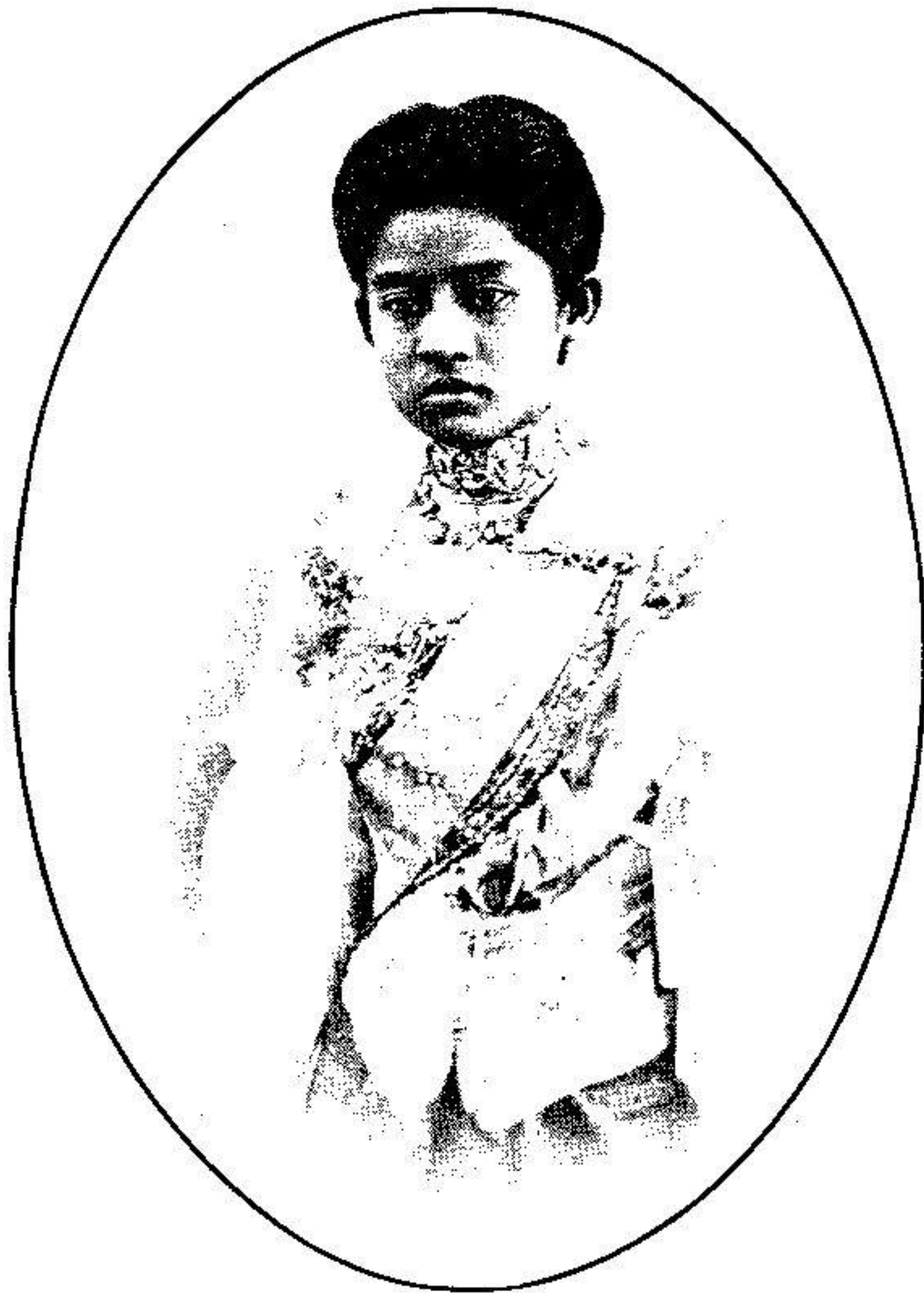
พระเจ้าฟ้างโช พระองค์เจ้าอรประพันธ์รำไพ ถ่ายเมื่อพระชันษา ๑๕ ปี