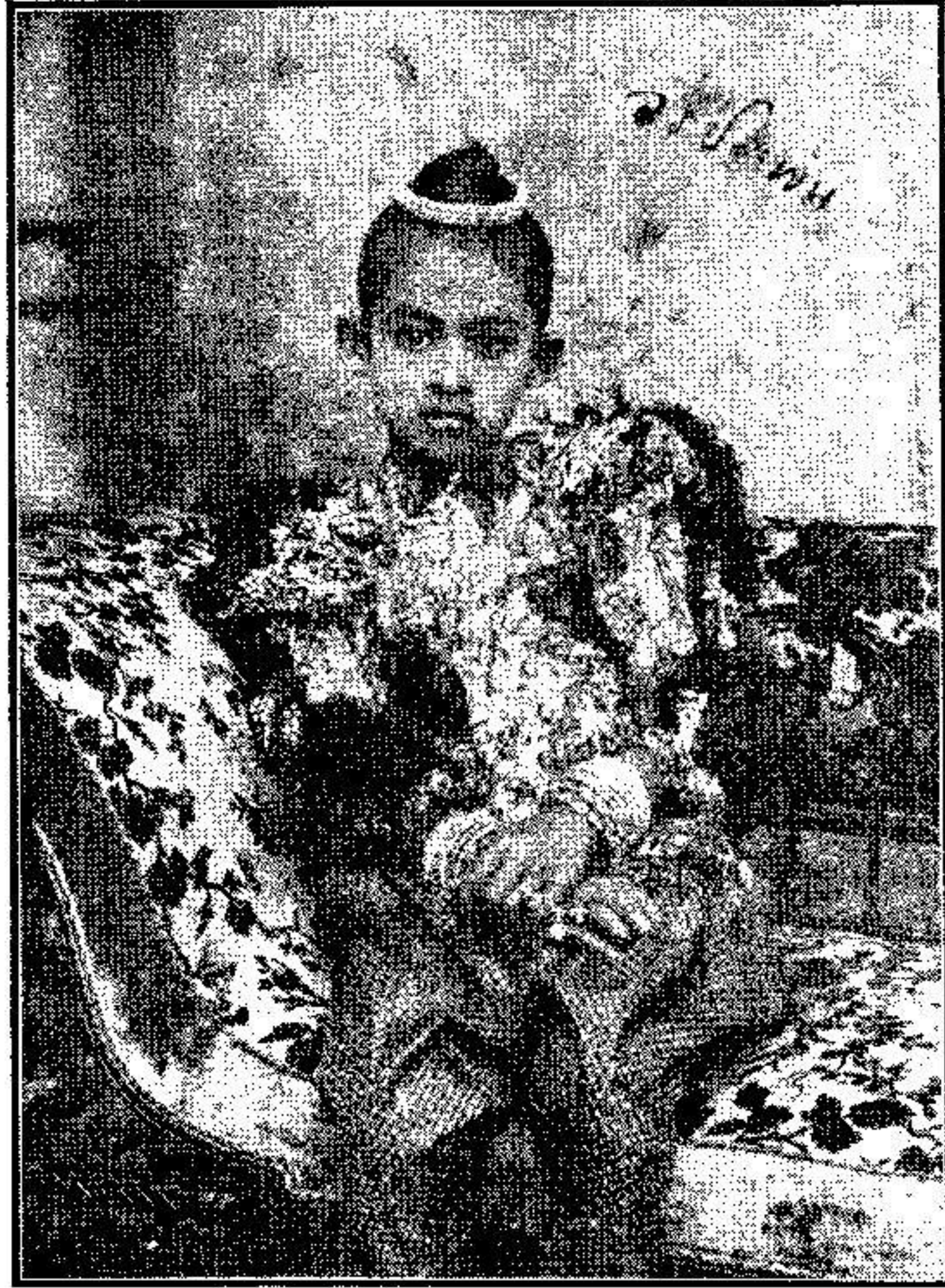
พระเจ้าฟ้าง Thao พระองค์เจ้าอรประพันธ์รำไพ ถ่ายเมื่อพระชันษา ๑๑ ปี