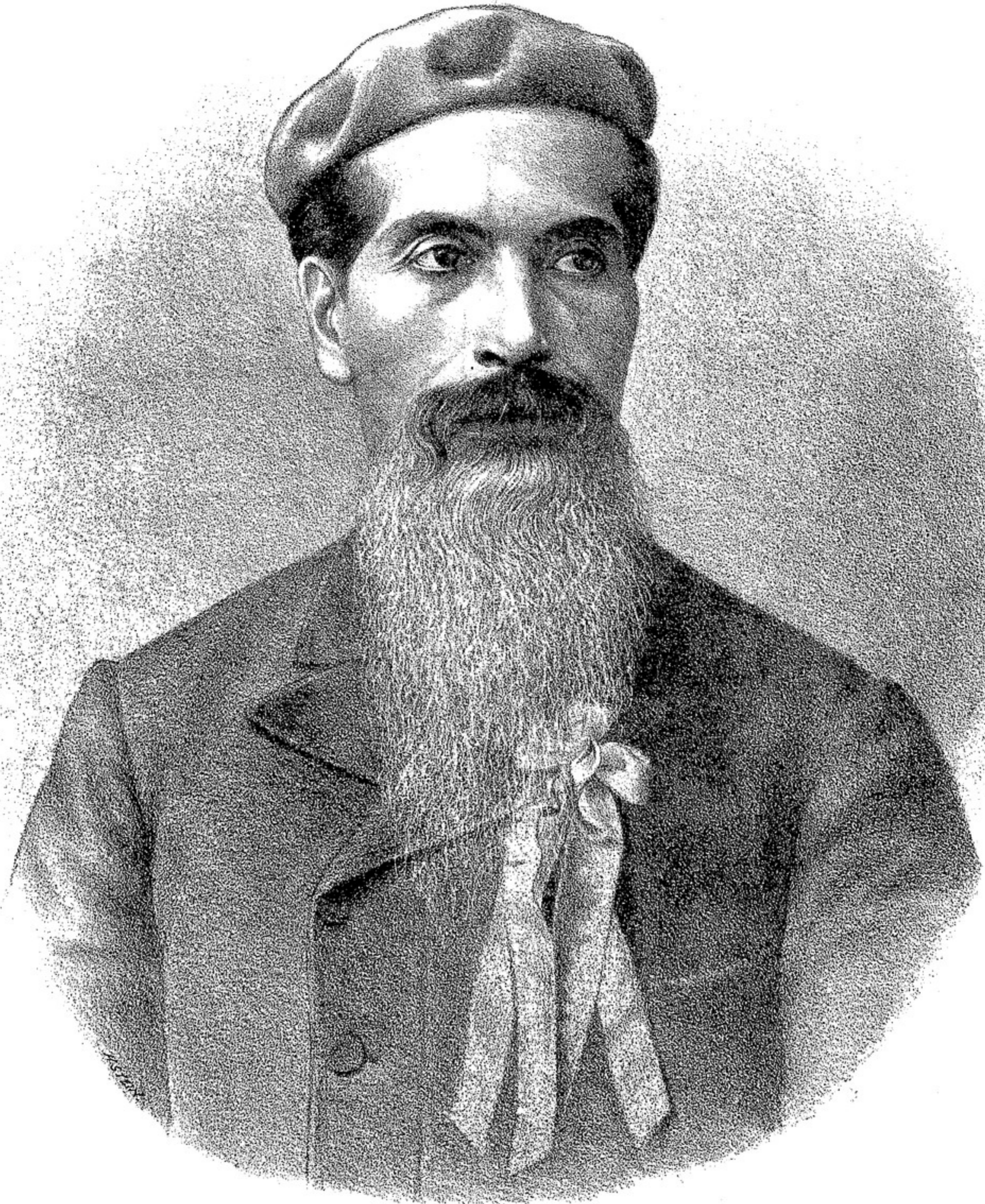
LEANDRO N. ALEM