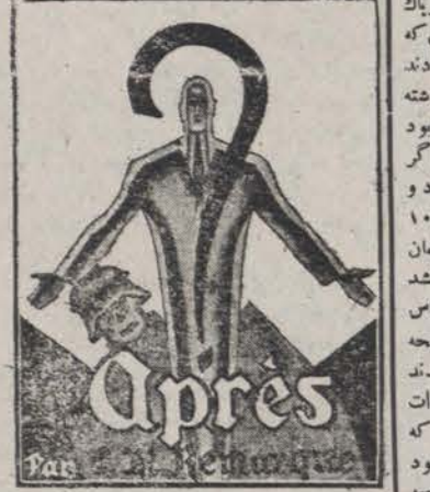
«در غرب خبری نیست بعد؟»

معاون وزارت خارجه - لایحه است مربوط ورود و خروج اتباع خارجه که از طرف وزارت خارجه تقدیم میشود دو فقره لایحه دیگری است راجع باحتیاجات نظیه از طرف وزارت داخله تقدیم میشود قبل وزارت طرق - برای مخارج راه آهن جهت سال ۱۳۱۰ لایحه تهیه شده که تقدیم می شود اختیارات کمیون عدلیه وزیر عدلیه - قصد داریم لایحه راجع باختیارات کمیون عدلیه را تقدیم کنیم لکن چون قبل از ورود بنده شرحی بکی از نمایندگان راجع به اداره تحدید و عملیات آن بیان کرده اند قیلا لازم میدانم مختصری جواب بگویم - بنده نمیخواهم منکر شوم ، شاید اشخاصی باشند که از مقام خودشان بهاء استفاده میکنند اظهار شد وارد دستور شود