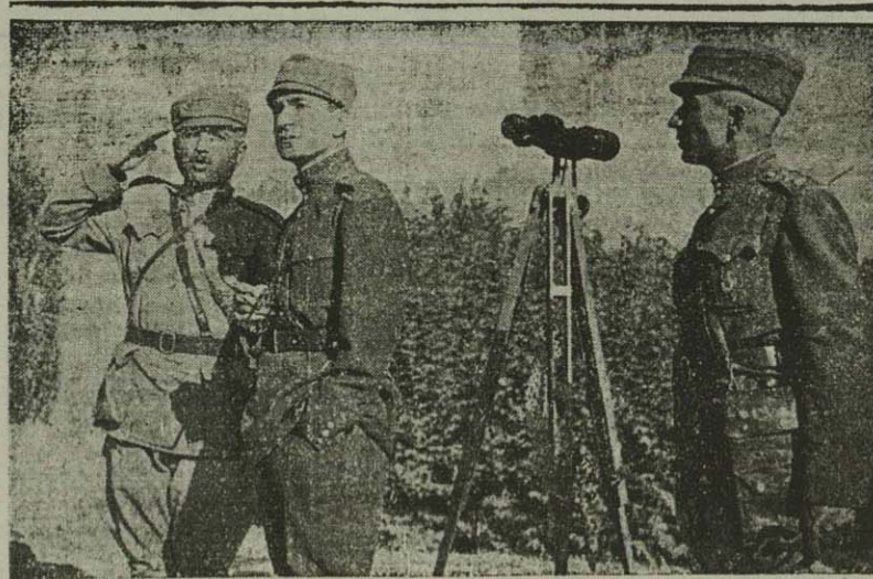
اعلیحضرت همایونی در پس از دیده گامهای مانور از سوی سرهنگ موم پیروزیا فرمانده نیروی آبی متوالاتی میفرمایند آقای سرهنگ مبین معاون دانشگده افسری و رئیس ستاد هیئت مدیره مانور نیز شرفیاب هستند