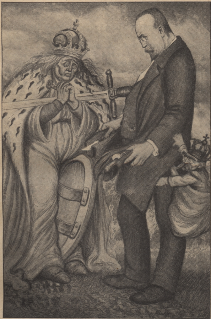
Ivan Hribar: — Quintus Fabius Maximus: „Vojna ali mir?! Voli!“

Na 114—117 straneh tretje knjige „Moji spomini“ priobčil sem po stenopisnih zapisnikih državnega zbora na Dunaju svoj govor z dne 16. marca 1909. leta. V dopolnilo dodajam tu karikaturno sliko, ki jo je kmalu nato narisal mojster Hinko Smrekar, akademski slikar v Ljubljani.