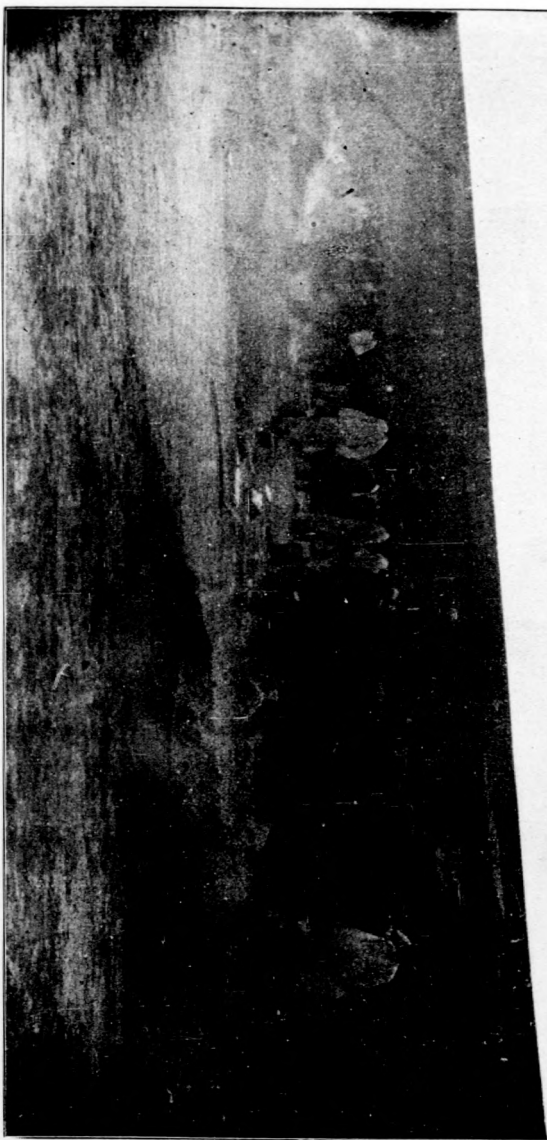
影攝時火舉品毒煙焚院法等北河