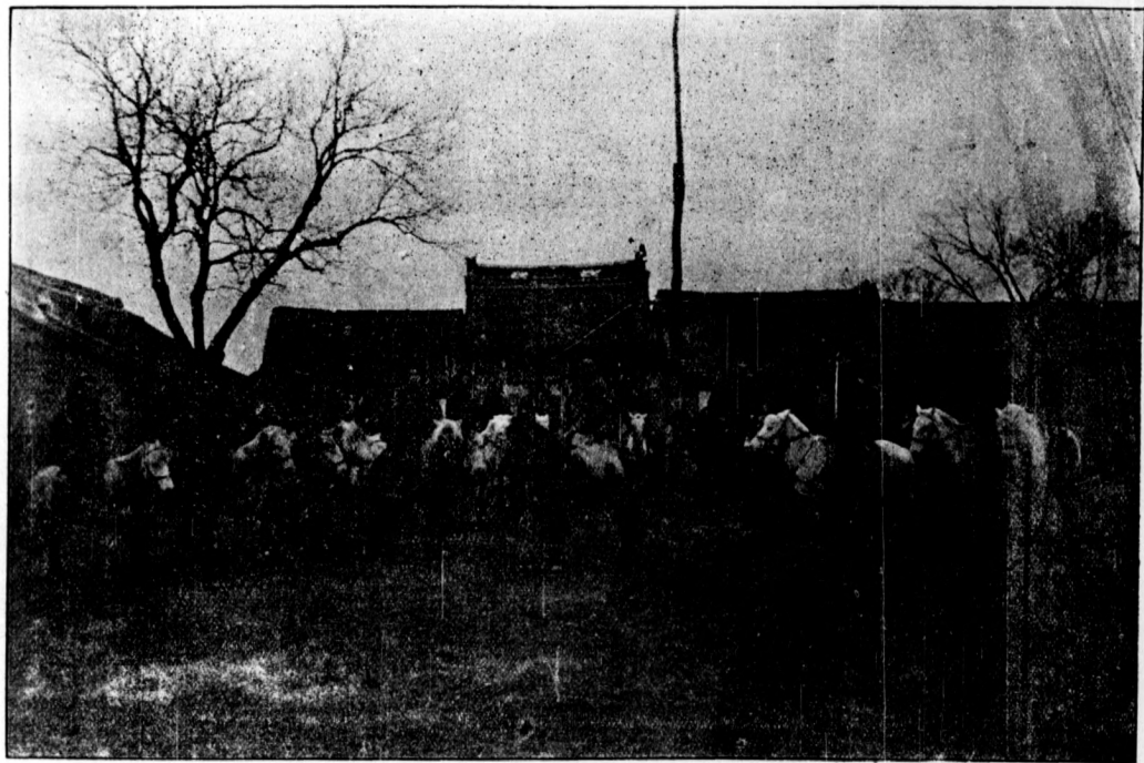
影合兵巡師官隊馬警巡縣鄉肥