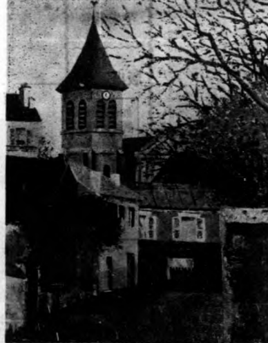
作 畫 畫 水 畫 歐 風 國 法

作 亦 頗 多，如 社 團 風 景 畫 亦 甚 多。G. H. 氏 所 作。湯 氏 以 長 於 風 景，著 稱 於 時，其 作 風 中 含 有 高 古 深 遠 之 意 味。右 圖 所 表 現 荒 涼 可 怕 的 教 堂，在 此 間 靜 寂 的 空 氣 中，下 下 靜 枝 搖 搖 垂 垂 的 枯 樹，微 風 吹 動，萬 類 俱 寂，使 我 們 在 感 覺 中，同 時 感 到 風 聲 與 鐘 聲，誠 風 景 畫 中 之 傑 作 也。