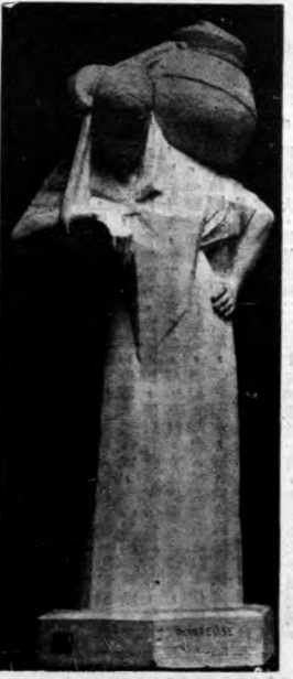
負 牛 乳 之 婦 人