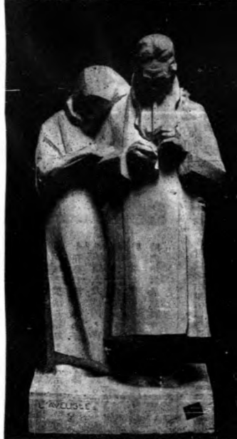
法 國 彫 刻 大 家 馬 與 列 作

高 爾 生 於 公 歷 一 四 五 二，以 一 五 一 九 年 卒，年 六 十 七。為 文 藝 復 興 時 代 藝 術 界 三 傑 之 魁 首。彼 不 獨 工 於 繪 畫，凡 彫 刻，建 築，詩 歌，音 樂，無 不 精 妙。且 對 於 物 理，數 學，工 程 等 科，亦 均 有 偉 大 之 發 明，其 足 以 啟 發 後 世 科 學 界 者，實 非 淺 鮮，故 歐 洲 人 士 咸 尊 之 為「全 能 的 天 才 家」云。