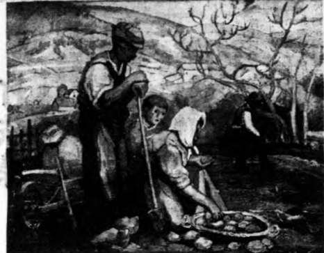
法 國 南 部 之 鄉 人

右 為 文 藝 與 時 代 大 利 人 高 爾 (Verdi) 之 名 作。畫 中 人 則 為 奧 琴 聖 賢 Soma Lisa 一 美 人 與 爵 女 士 L. a. Joconde。女 士 出 自 于 族，生 平 端 淑，極 為 舒 適。萬 與 音 言，環 繞 耳 邊，其 精 神 自 必 恬 愉，品 性 氣 質 亦 隨 以 優 美，故 欲 覓 一 環 境，暫 離 女 子，願 其 能 得 百 得 之 狀，以 為 人 之 模 範。高 爾 之 人，雖 其 似 百 得 之 狀，以 為 人 之 模 範，高 爾 之 宮 室，花 木 頗 多，甘 樂 逸 矣，極 人 間 之 快 樂，高 爾 極 其 欣 然，乃 成 此 畫。然 其 神 秘 的 微 笑，與 合 情 的 秀 麗，高 爾 前 後 易 稱，至 數 十 百 次，歷 時 四 年。