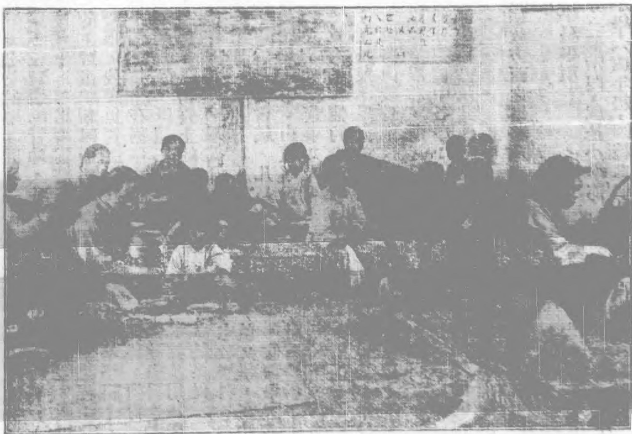
（所容收四第之學小廿） 飯開之所容收民難教回街牛平北