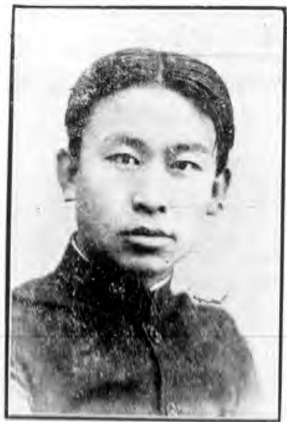
旭封名三第 (學中鐸民)