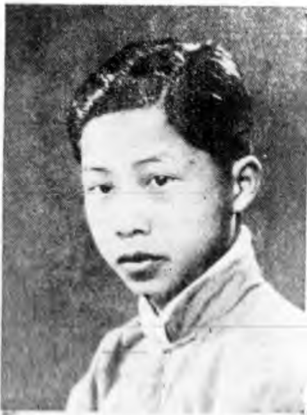
寅馮名四第 (學中英育)