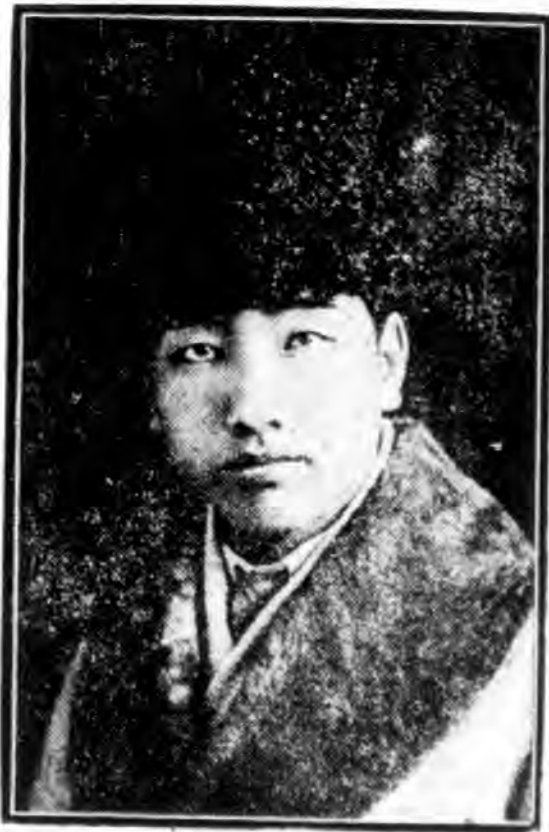
魁步許名二第 (範師平北)