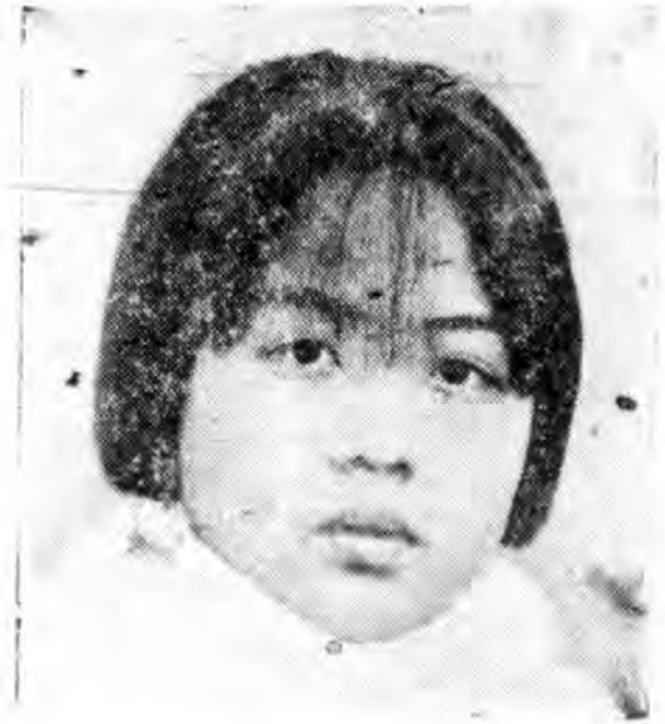
敏自孫名一第 (校分師北)