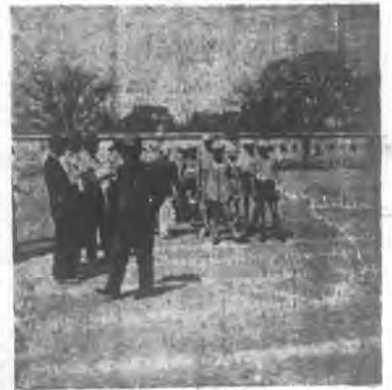
形情時動運生學察觀長院副藤佐為圖