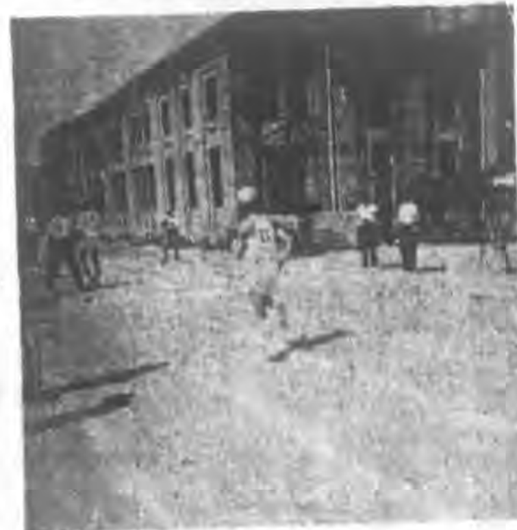
形情時途中至賽走競米千一為圖

(本一) 成績為十米七六。團體比賽總分白組得一百零一點(負)赤組得一百二十四點(勝)