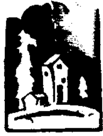
此圖顯示了農村的一角，反映了當時的社會環境。

百元付之。農人租種田地之法，約有二端，一爲常年租種，再爲臨時租種。臨時租種以租一季或二季爲多。常年租種普通多爲一年或五年。租地之時多於清明節前後議定。又租地時分交錢租與糧租，現錢交租，先交租後種地或秋後交租者，常久租地者，必須有妥實保人，立有租契一紙，內有「不許轉租轉典，倘有拖欠地租，介紹人負完全責任」等語。 西郊一帶地畝，分上中下三款，村內通爲旱地，專就旱言之，上等之地，無論高坡平坦，若其土質肥滿，四面有渠道，即稱爲膏腴之田，每畝價值約百五十元至二百元。中等之地，或長或短，或彎或斜，有渠道可通，土質稍次，每畝價值約百元至百五十元。下等之地坑坎凹凸不平，或窪，或沙質，或鹹質每畝在百元以下。以上皆就旱地而言，其他如水地、園地、宅地、墳地則期依其情形不同，價格等又當別論。 中國雖稱以農立國，對農人子女教育尙不注意，事體以論，政府雖有人提倡，僅不過空談耳。迄至今日，農人每見城市中學堂則以「洋學生」呼之，村中若有私塾，所謂師長皆以「一吃，一打」爲宗