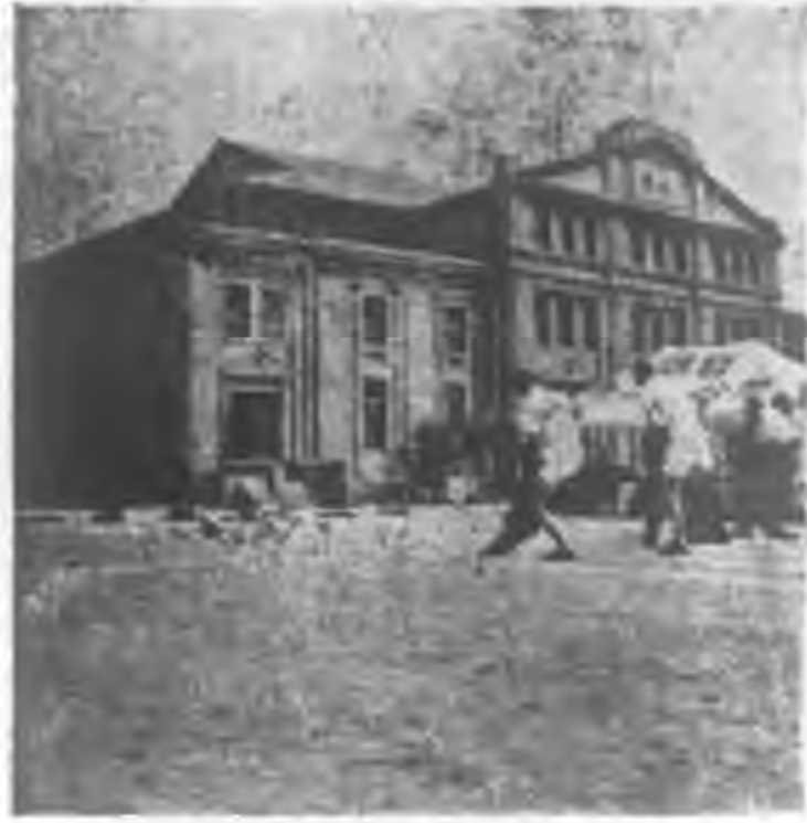
形情時發出力接米百四為圖

本年來最好的一天，真是天助我等以運動的良好機會，前次運動會中所見之呆板動作，於此次運動會中老無，而此次運動會中所表現的團結精神，實屬令人欣喜，對於師大學生能夠遠道來和本院學生比