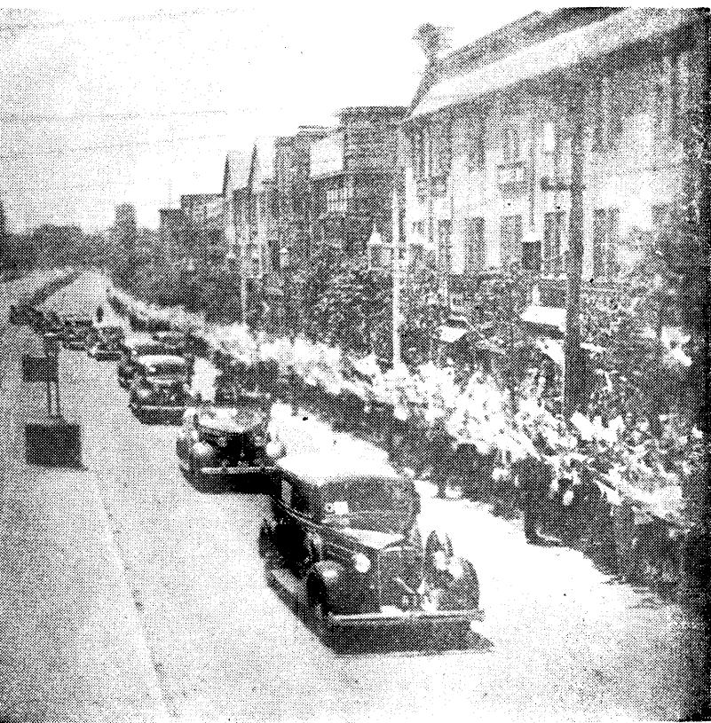
神戶各團體沿途歡迎汪主席