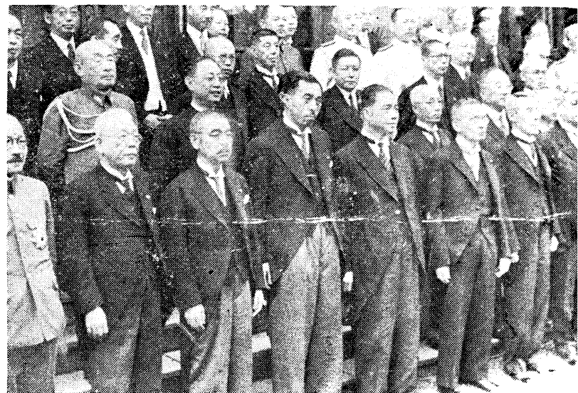
主席與近衛總理大臣及各大臣合影