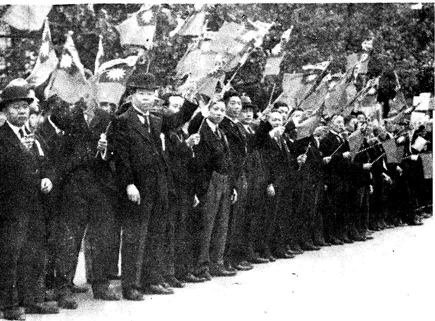
迎歡隊列站車在僑華京東