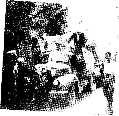
忠棚移人民教館停放