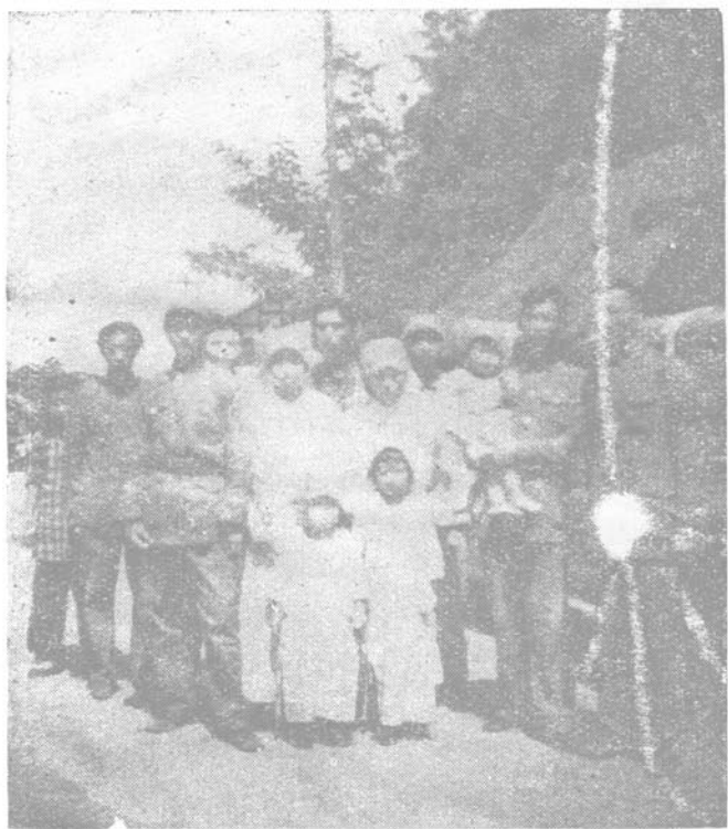
影合族遺長師故戴