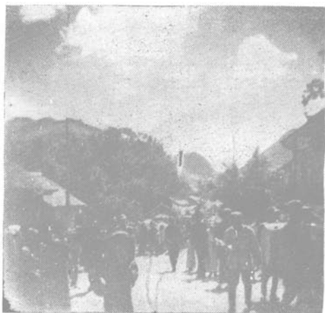
市氏沿途參加迎候