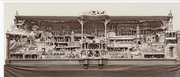
Třebechovický betlém, asi 1935–1936 [1]