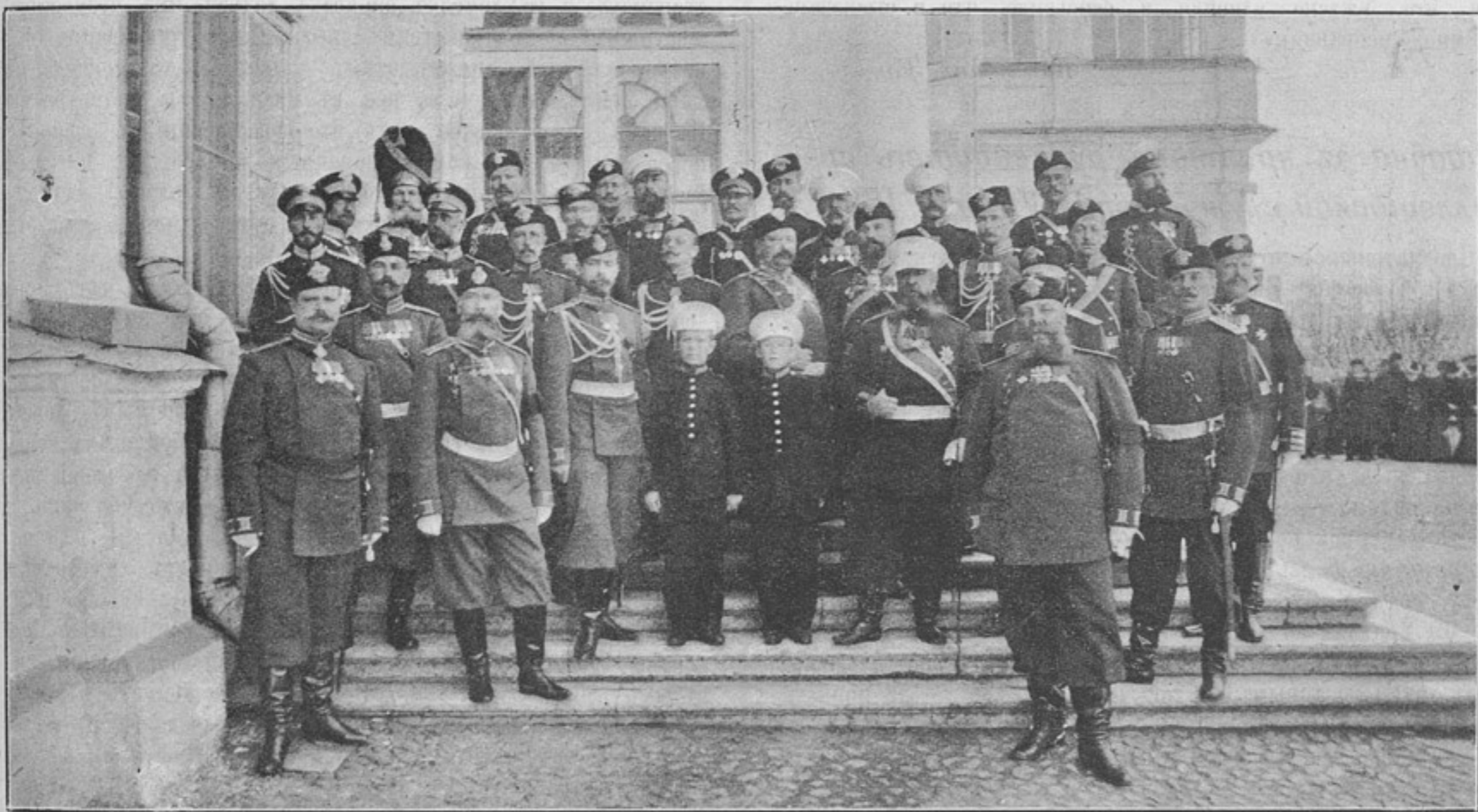
Къ статьѣ «Суворовская депутація».

Въ подтвержденіе замѣтки, помѣщенной въ 490 № «Развѣдчика», о безцеремонности гг. полицейскихъ чиновниковъ въ присвоеніи себѣ военной формы, укажу на два случая, бывшихъ со мною въ прошломъ году. Былъ я въ Казани, въ отпуску, и въ одинъ прекрасный жаркій день вхожу въ вагонъ конки и первымъ, что бросилось мнѣ въ глаза, это сидящій, весьма представительный, полковникъ въ погонахъ армейской пѣхоты. Понятно я сейчасъ же отдалъ ему честь, а онъ очень любезно, за неимѣніемъ на головѣ фуражки, кивкомъ головы