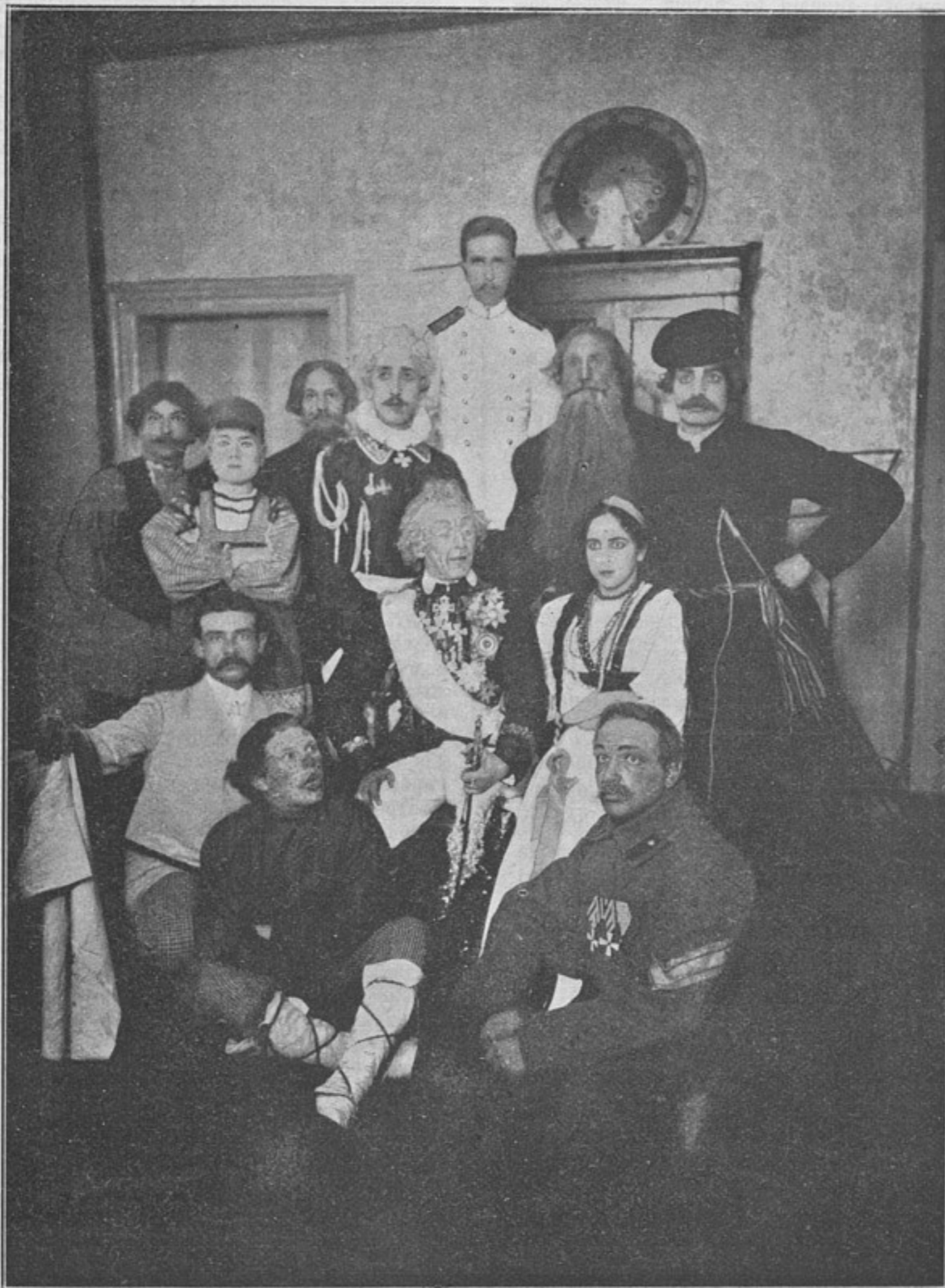
Къ корреспонденціи «Налуга».

Приказъ прочесть въ ротахъ и батареяхъ при собраніи всѣхъ нижнихъ чиновъ».