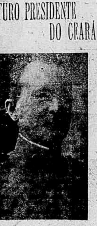
Coronel Benjamin Liberato Barroso