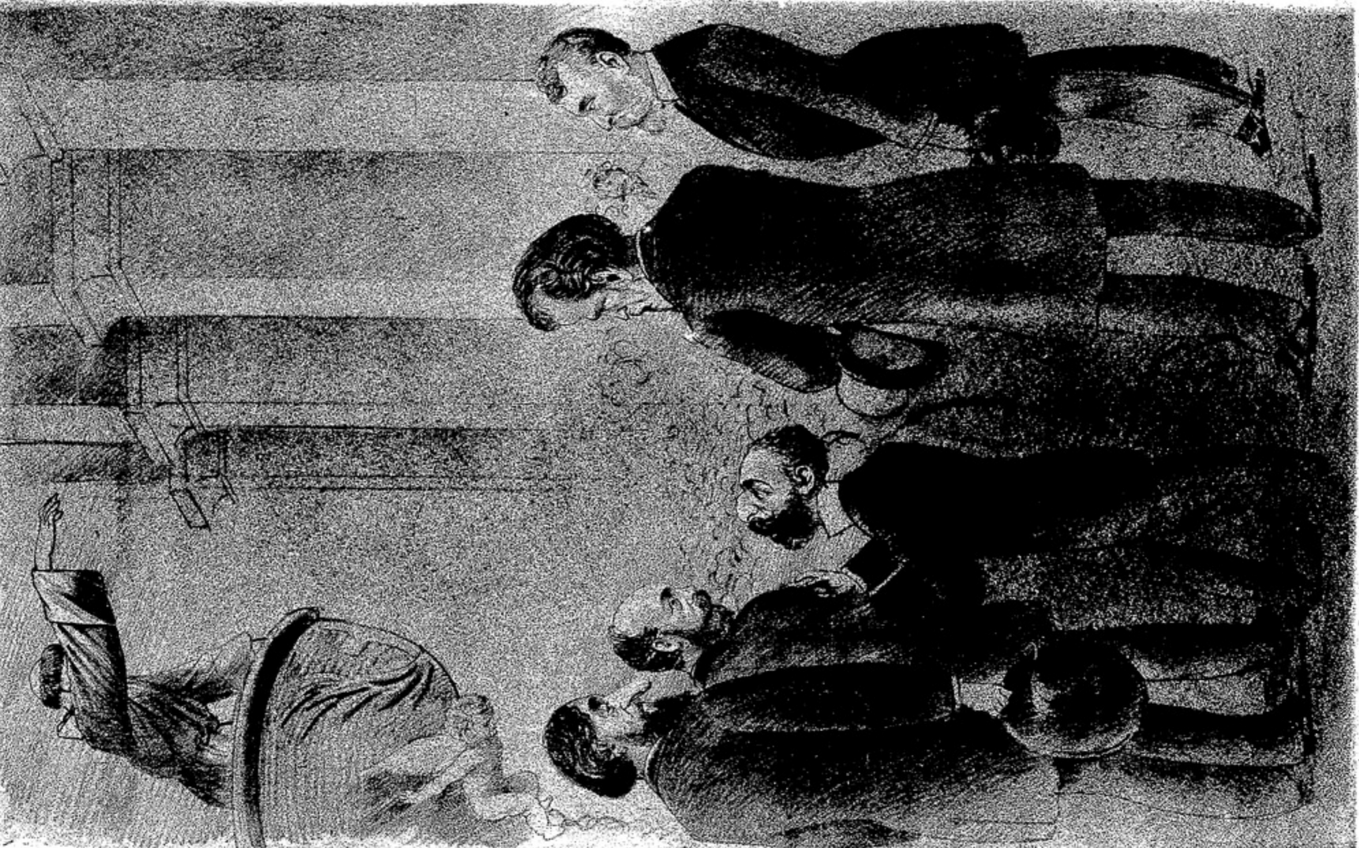
— Ah, Dr. Barilo, nosotros si que despreciamos a las riquezas! — Por fuerza, Rufinito, por fuerza.

UN SERMÓN SOBRE EL DESPRECIO DE LAS RIQUEZAS