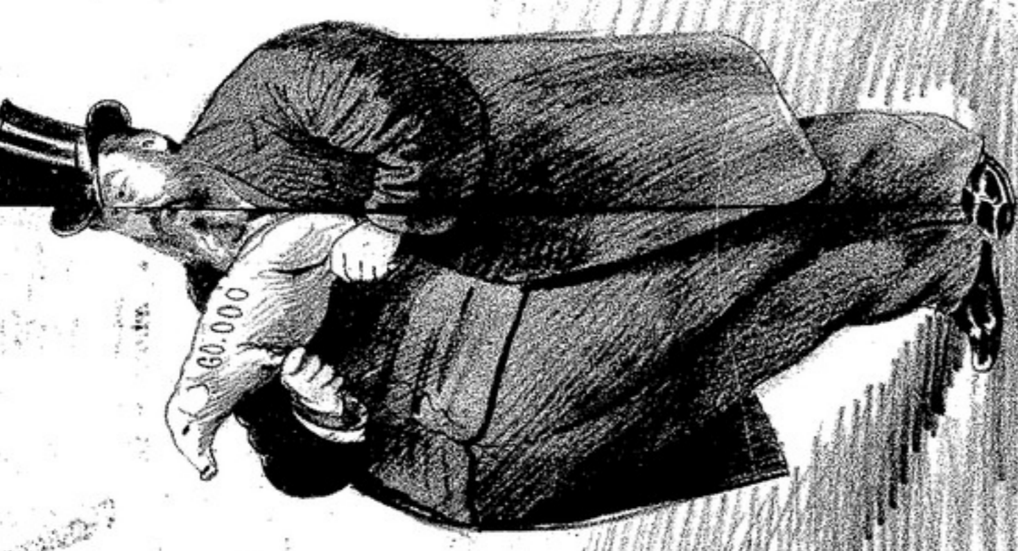
El político diputado Marino Fierro tiene un motivo especial al enterrar el tesoro.