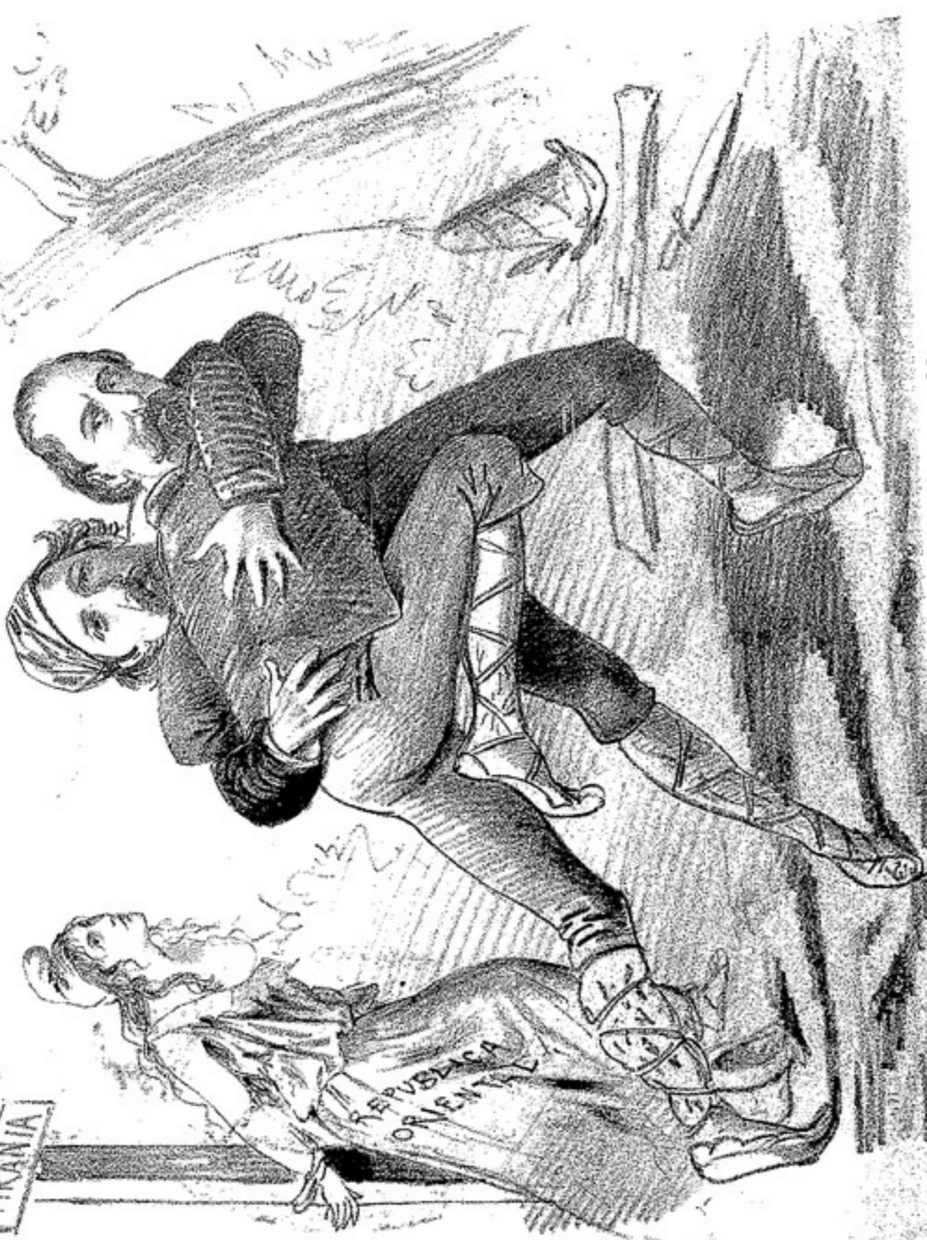
Comedia que se representa en la otra orilla.