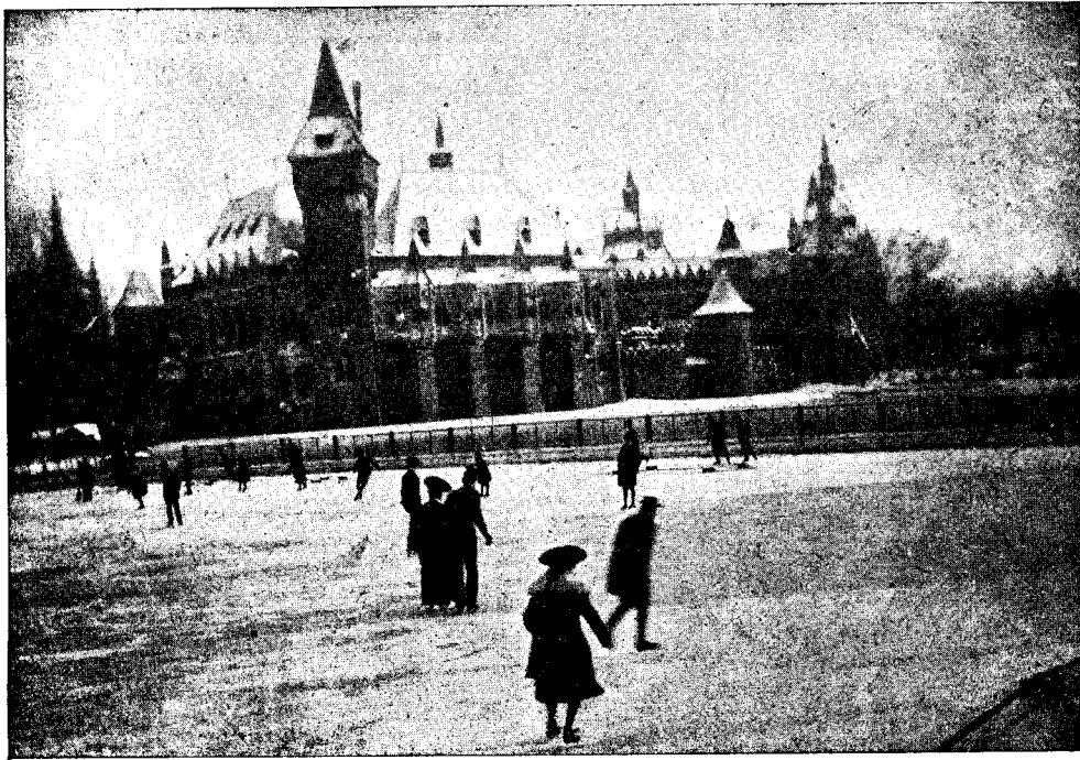
L a p a t i n a t .