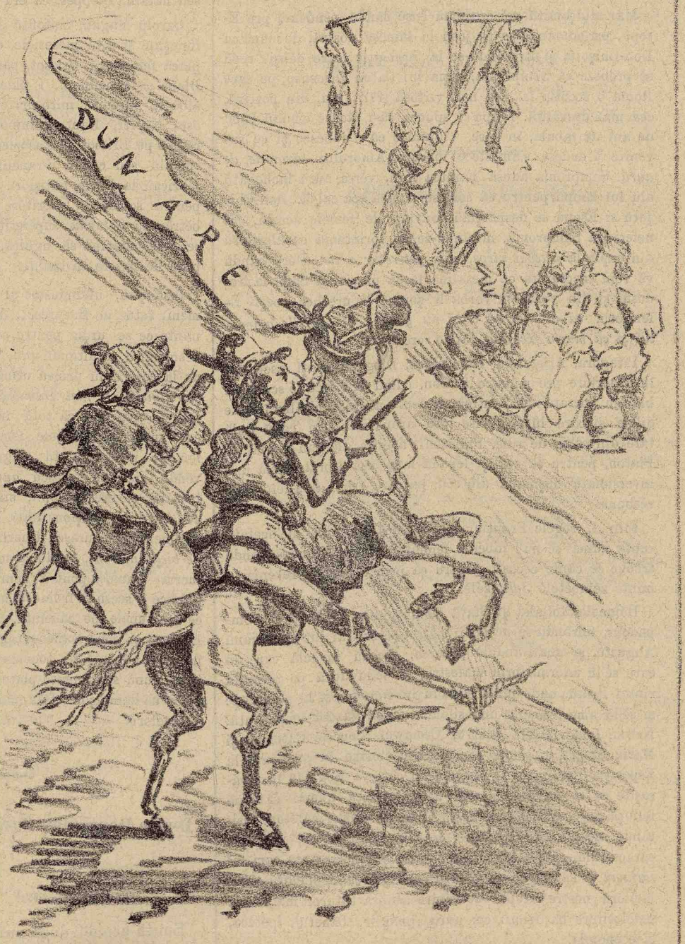
Marea pehlivăniă politică a ciortagiilor nostrii. Dêru turculu e totu turcu și pehlivani suntu totu pehlivani!...