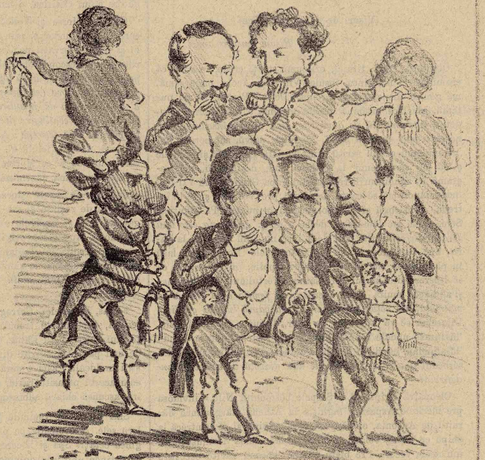
—Cei mai perfecți hoți suntu cei ce se fură unul pe altul prin complimentele ce 'și facu.