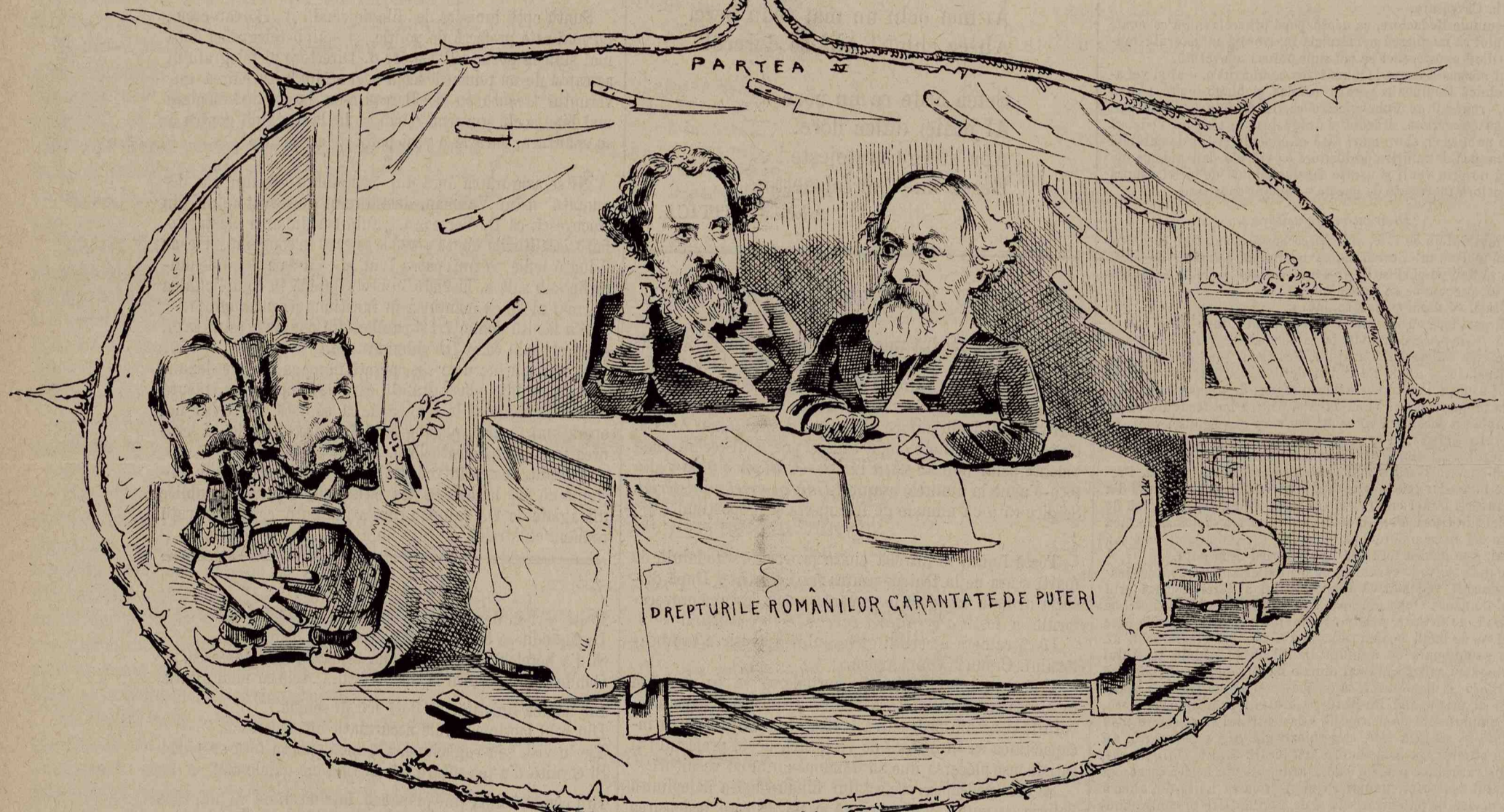
P. VI. Curios! eu totă infama noastră ingraturdine, armele noastre nu'i ajunge. — (În fața durerosei realități credem că acești părinți nu 'și vor mai răsgăia copii pe viitoru nepuși la încercare).