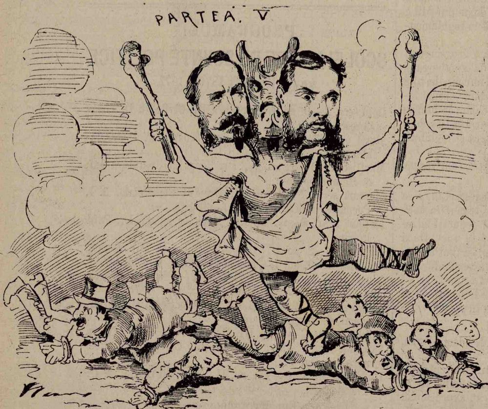
P. V. — Ne-am ajuns scopul, de acum să sdrobim și pe progenitorii noștri.