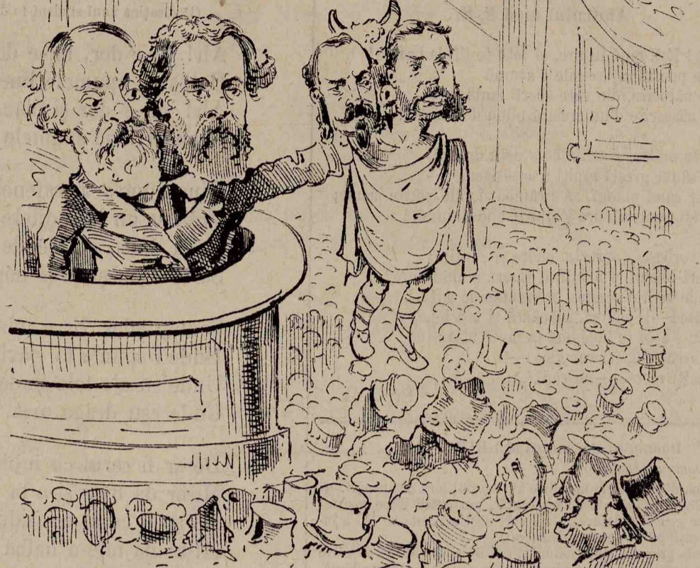
P. II. — Iată-i, corpuri din corpul nostru, ei vă va face fericirea; dați-le ascultare și supunere.