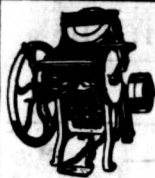
此乃本廠所製之機器