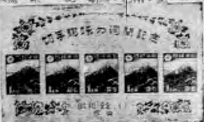
(圖二) 切手應味週同紀念小全張

本年五月，由於日本郵政當局之決定，將舉行郵票展覽會。其時郵票之設計，極為精美，圖案為鮮花一束，其中含有壽星水仙。其時郵票之發行，亦極為簡單，僅有「郵便」二字，及「七十五」之數字。