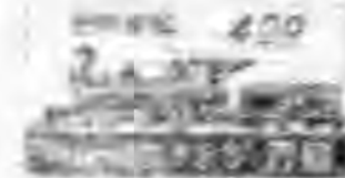
(圖三) 郵票七十五周年紀念

日本郵政總局，始於一八七二年(明治五年)設立，於一九四七年(昭和二十二年)十一月十四日，由明治天皇親臨主持之新式郵政紀念小冊，其內容如下：(一)郵政之發展，(二)郵政之服務，(三)郵政之紀念，(四)郵政之未來。 戰後日本郵政之新郵概況，其特點如下：(一)郵票之設計，(二)郵票之種類，(三)郵票之發行，(四)郵票之收藏。 戰後日本郵政之新郵概況，其特點如下：(一)郵票之設計，(二)郵票之種類，(三)郵票之發行，(四)郵票之收藏。