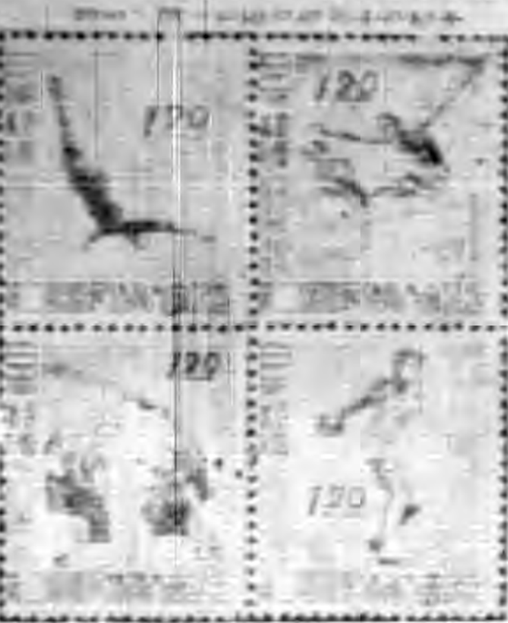
(圖四) 郵票七十五周年紀念