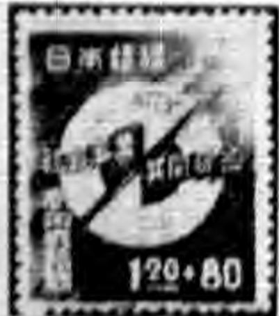
(圖五) 社會事業基金宣傳票

普通郵票之種類及發行日期如下： 種類 面額 發行日期 一、投降初期使用之普通郵票 1.00, 2.00, 3.00, 4.00, 5.00, 6.00, 7.00, 8.00, 9.00, 10.00 1945.11.10, 1946.1.1, 1946.3.1, 1946.5.1, 1946.7.1, 1946.9.1, 1946.11.1, 1947.1.1, 1947.3.1, 1947.5.1 二、和乎第二版郵票 1.00, 2.00, 3.00, 4.00, 5.00, 6.00, 7.00, 8.00, 9.00, 10.00 1947.1.1, 1947.3.1, 1947.5.1, 1947.7.1, 1947.9.1, 1947.11.1, 1948.1.1, 1948.3.1, 1948.5.1, 1948.7.1