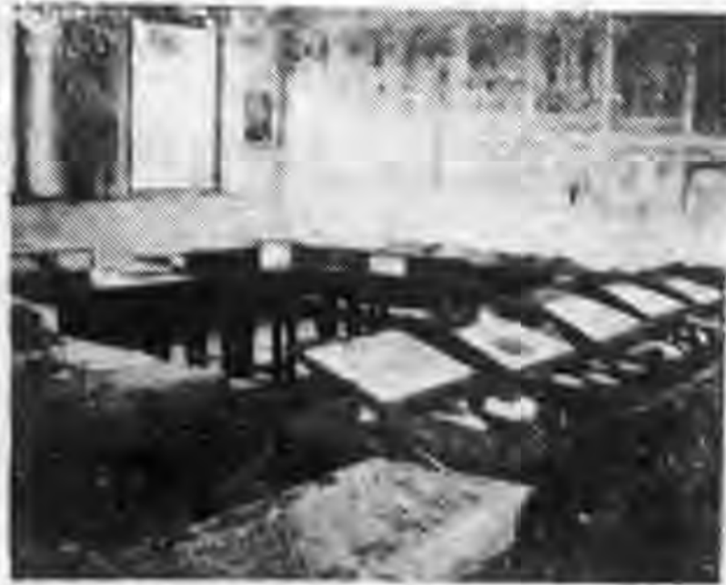
角 一 室 覽 展 生 衛

以前二者最為出色，計營養模型十一組，病理模型七組，蚊蠅模型標本六種，生理掛圖一套（十張），營養掛圖一套（十六張），營養圖說一套（八張），衛生習慣圖一套，急救掛圖一套，其他圖表多種，夏令常備藥品十五種，夏令衛生食品多種。（陳列品一覽表略）