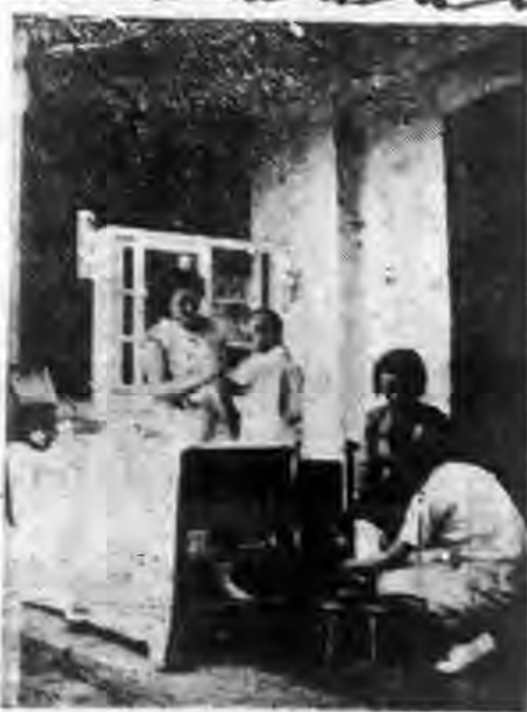
作工察醫的室生衛校學民國路武洪

2. 藥品——上學期由健康教育委員會，配發藥箱，各校又於設備費中，撥款購置藥品，本學期健康委員會已組織藥品採購委員會，選購藥品，分發各校，將更見充實。