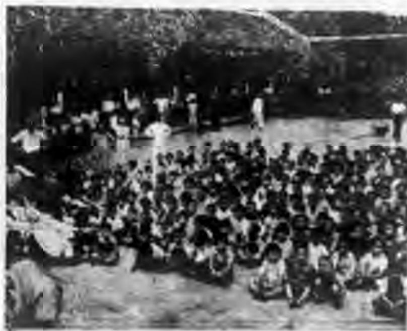
演 表 生 衛 令 夏

十、夏令衛生表演會：在十三日（星期五）下午舉行，各班均參加精彩節目一項，有舞蹈歌劇等均以夏令衛生為中心，有家長數十人來校參觀，雖在烈日高照下，而兒童情緒始終不衰。