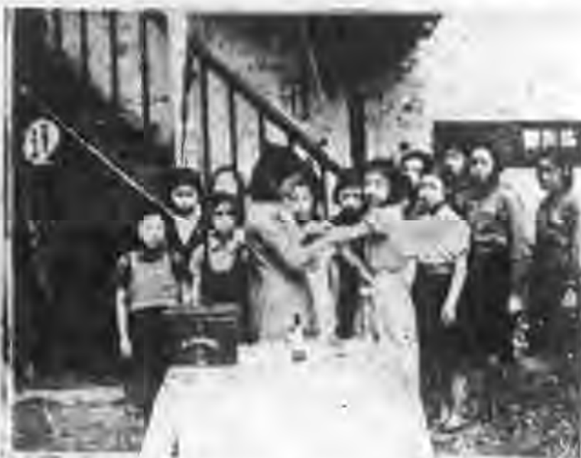
針防預射注校各赴分會委教健