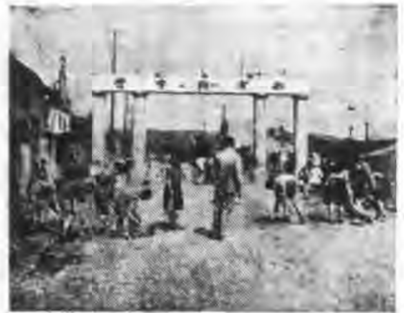
除 掃 頭 街