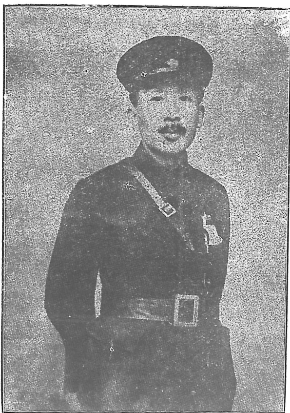
蔡 公 時 遺 像