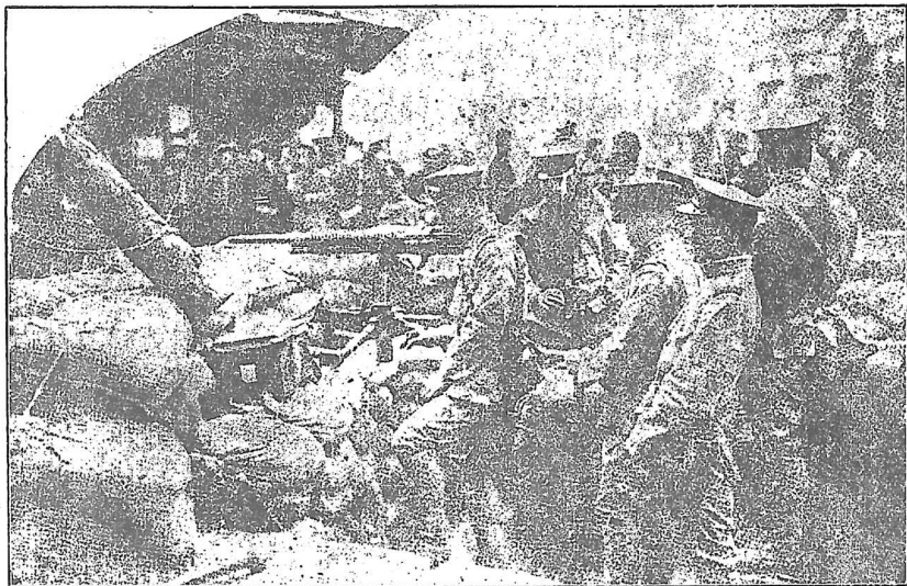
濟南敵軍攻擊情形