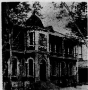
樓民勤宮滿春長 (門光承即門前)