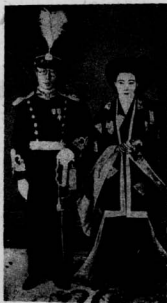
下圖： 溥傑與日婦嵯峨浩（在東京結婚後）