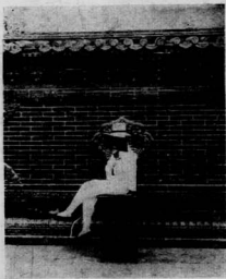
上圖：溥儀遊戲照相（化身） 下圖：溥儀遊戲照相（掩面）