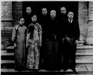
三 格 格 出 嫁 (• 謝賓孫青學 • 謝韻二 • 青學鄭翁 • 格格二人二第 • 右至左白)