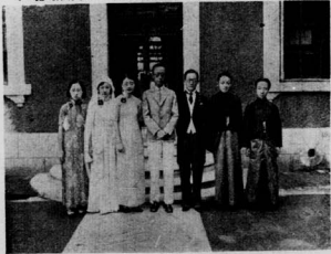
三 格 格 出 嫁 (• 傑博 • 謝韻二 • 謝韻三 • 傑博 • 后之儀博 • 格格三 • 格格二 : 右至左白)