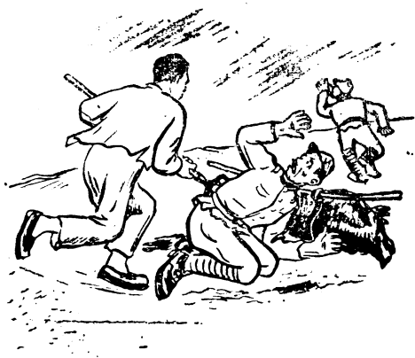
湯三一叉子朝後面鬼子背上進去。

湯三氣鼓鼓的把叉子扔在地下，瞪着眼睛看着那個已經死掉的鬼子說：「現在你就知道山東人不是好惹的了！」