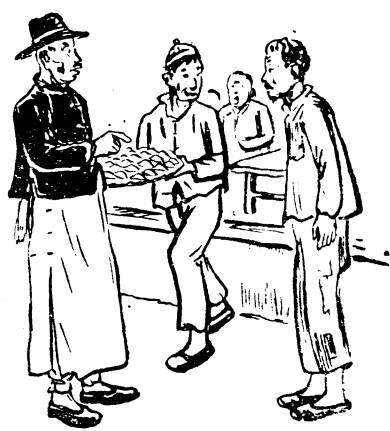
「媽的，還有錢能吃飯子？」

第二天，他把所有的破爛都賣了。他買了菜和麵，也買來了毒藥，悄悄的把它拌在餃子餡裡，剛把餃子包好了，僞保