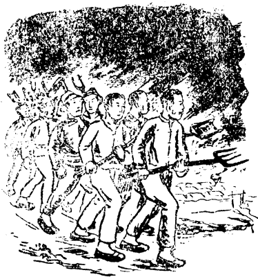
。姓百老的頭簍拿些了來