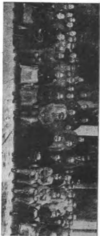
影攝攝就官長各會員委烟禁及部敎銓會員委選考暨院試考府政民國