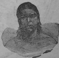
種 色 紅