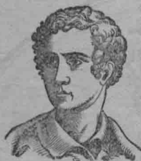
種 色 白

世界人種、有黃色的、有白色的、有櫻色的、有黑色的、有紅色的、黃種人占亞洲的大部、和歐洲的一小部。現在除中國、日本、暹羅、匈牙利外、其餘各國、都滅亡了。白種人勢力最大。歐洲的大部分、亞洲的西南部、非洲的北部、都是這族所居的地方。這族人開闢佔領的土地、到處都有。如非洲、大洋洲、美洲等處。櫻色人種居亞洲南方海島上、同大洋洲海島上。黑種人住非洲。紅種人住美洲。這三種人的知識很淺。他們的土地、差不多全被白種人佔去了。他們有許多人供白種人做奴隸牛馬使用。有許多人被