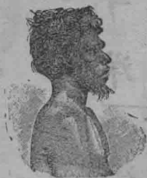
種 色 櫻