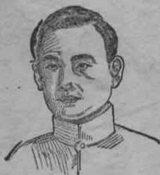
種 色 黃