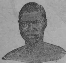
種 色 黑