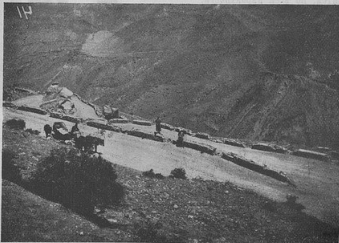
Эззели-Тегеранская дорога. Спускъ къ ст. Мулла-али. (Къ ст. «Гребенцы въ Персіи»).

Двадцатидневный переходъ до Рустамъ-абада штабъ гребенскаго полка совершилъ легко, шутя, и къ 3 час. дня