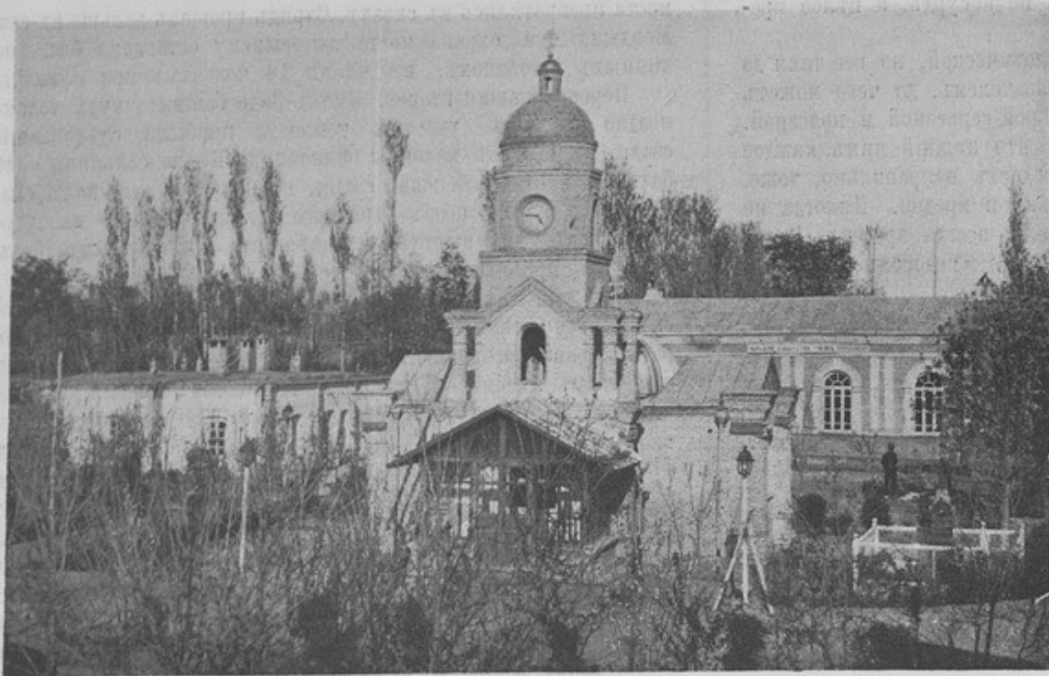
Церковь при управленіи Энзели-Тегеранской дороги въ г. Назвинѣ. (Къ ст. „Гребенцы въ Персіи“).

гребенцы уже отдыхали на бивакѣ въ палаткахъ, разбитыхъ слѣва отъ шоссе. Вечерѣло. Солнце давно уже скрылось за горы, а салъянцевъ, артиллеріи и 3-й сотни все еще не было видно. Только когда уже стемнѣло, колонна подошла къ биваку и расположилась на ночлегъ. Въ 10 час. вечера на бивакѣ царилъ уже полная тишина, и только пофыркиваніе лошадей изрѣдка указывало на присутствіе здѣсь русскихъ войскъ, охраняемыхъ дозорами.