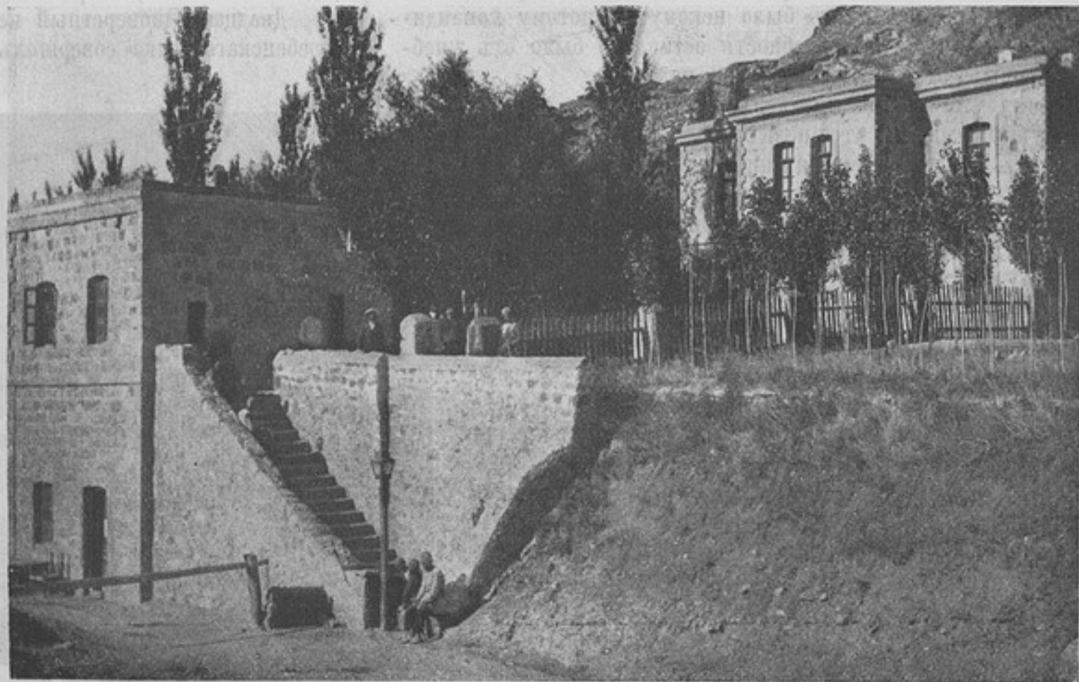
Юзбашчайская застава. (Къ ст. „Гребенцы въ Персіи“).

23-го ноября колонна передвинулась изъ Рудбара въ Менджиль. Переходъ былъ всего лишь въ 13 верстъ, а потому къ 11-ти часамъ утра гребенцы были уже на мѣстѣ ночлега, гдѣ и встрѣтили свою 3-ю сотню, готовую къ выступленію назадъ по правому берегу рѣки. Задержка въ