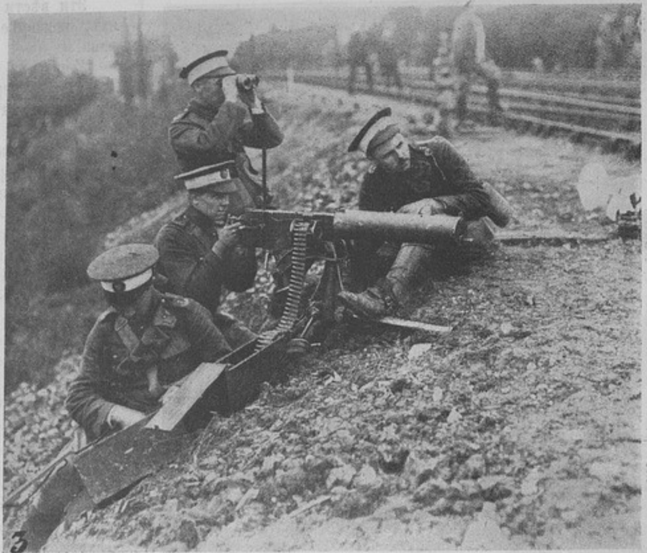
Сцена изъ жизни англійскихъ войскъ. Пулеметь на позиціи.

На ночлегѣ, уже поздно вечеромъ, получено было отъ начальника колонны приказаніе, чтобы гребенцы завтра выступали не въ головѣ колонны, а сзади, послѣ пѣхоты, въ 10 часовъ утра. Повидимому полковникъ К—зе опасался, что казаки снова могутъ захватить лучшее по его мнѣнію