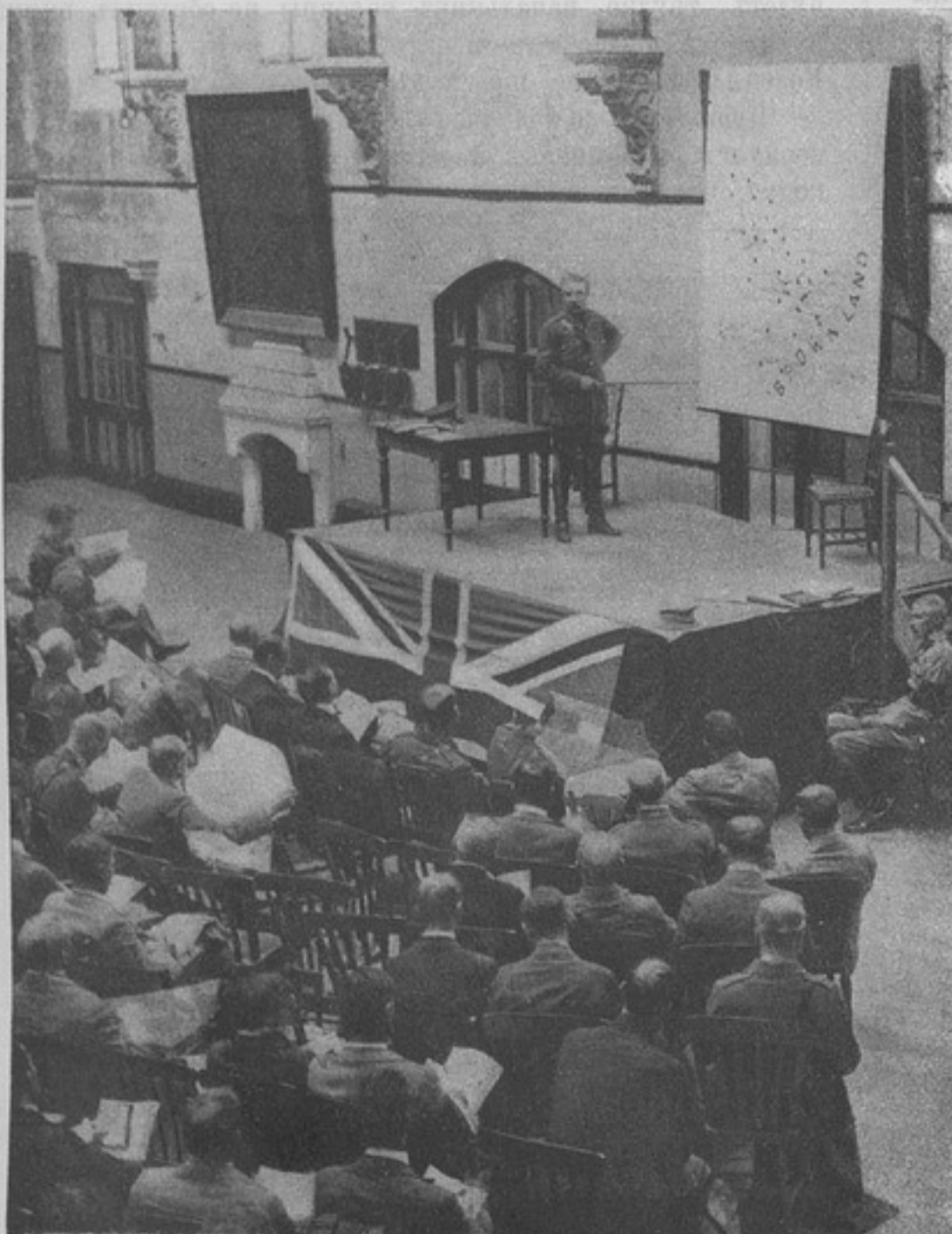
Сцена изъ жизни англійскихъ войскъ. Офицеръ генеральнаго штаба читаетъ для офицеровъ и журналистовъ сообщеніе о предстоящихъ маневрахъ, на которыхъ они будутъ присутствовать.

Здѣсь на ночлегѣ отъ начальника штаба отряда получено было командиромъ полка письменное сношеніе, разрѣшавшее гребенцамъ двигаться далѣе въ Казвинъ самостоятельно. Оно гласило: «начальникъ отряда приказалъ: выдѣлить изъ состава 2-го эшелона обозъ штаба отряда и обозъ ввѣреннаго вамъ полка и