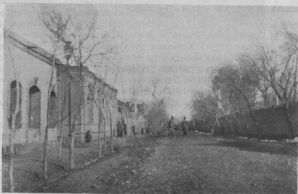
Улица русской мисси въ Казвинѣ. (Къ ст. «Гребенцы въ Персіи»).

3-я сотня цѣликомъ была придана къ штабу отряда для