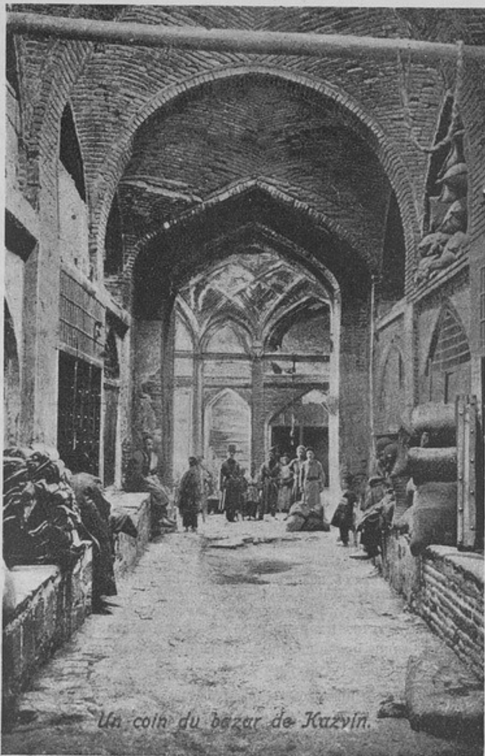
Ворота у входа въ ряды Казвинскаго базара. (Къ ст. „Гребенцы въ Персін“).

болѣе раннемъ выступленіи сотни произошла по причинѣ долгихъ розысковъ подходящаго переводчика.