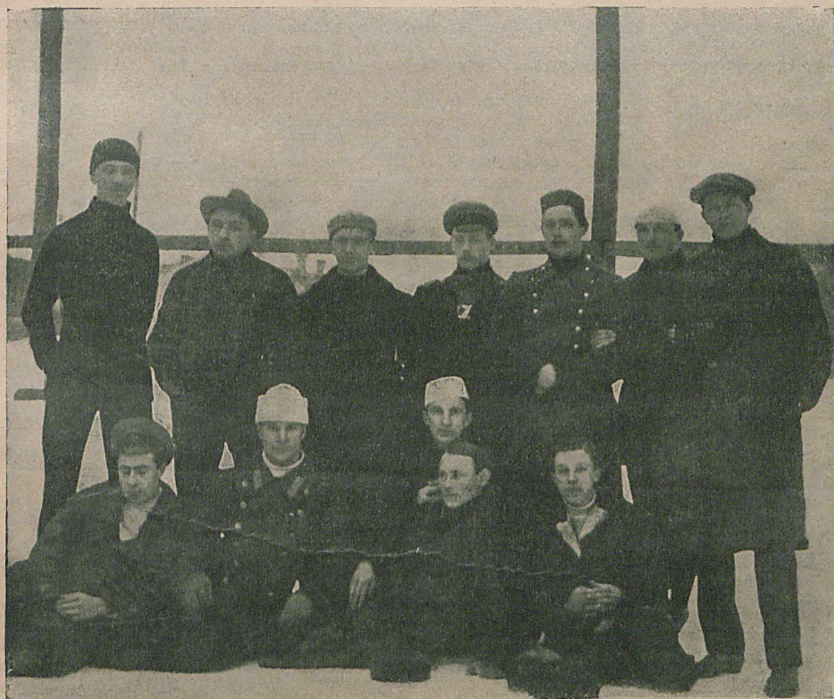
Общая группа участниковъ состязаній на «первенство Россіи» въ скоростномъ бѣгѣ на конькахъ на 1916 годъ.