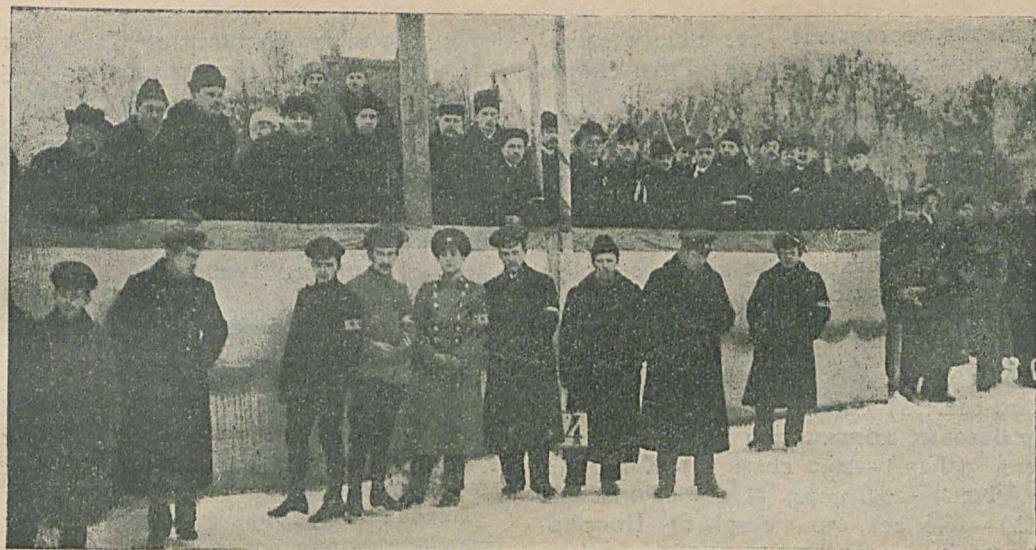
Судейская на состязаніяхъ на первенство Россіи въ скоростномъ бѣгѣ на конькахъ.