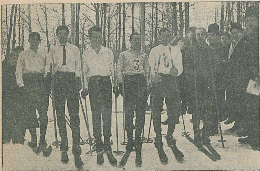
Группа участниковъ состязаній на призъ М. О. Г. Л. и В. С. 10 янв. т. г.