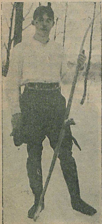
Денте («Могливецъ»), выигравшій призъ въ память учрежденія М. О. Г. Л. и В. С. 10-го января т. г.

20-ти-верстную гонку участники чемпионата закончили какъ разъ въ обратномъ порядкѣ и теперь каждый изъ нихъ имѣетъ по 4 очка.