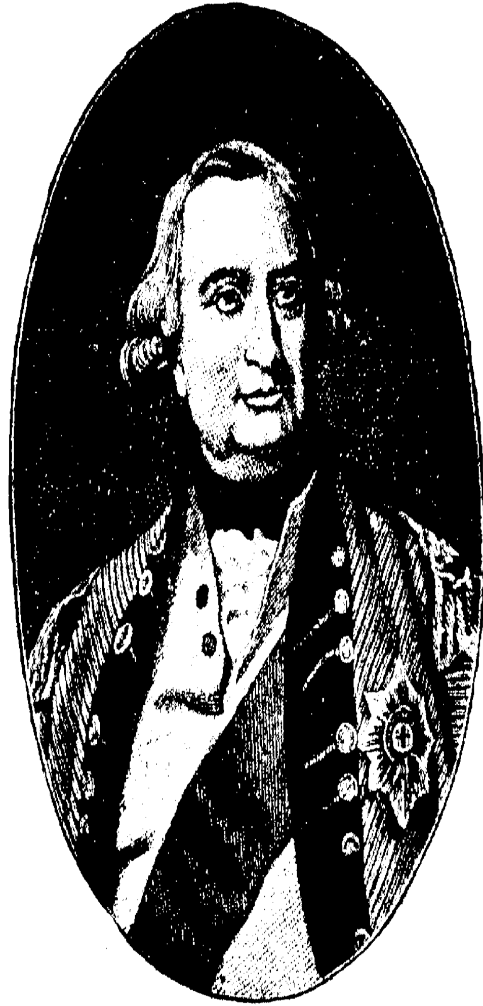
লর্ড কর্নওয়ালিস ।