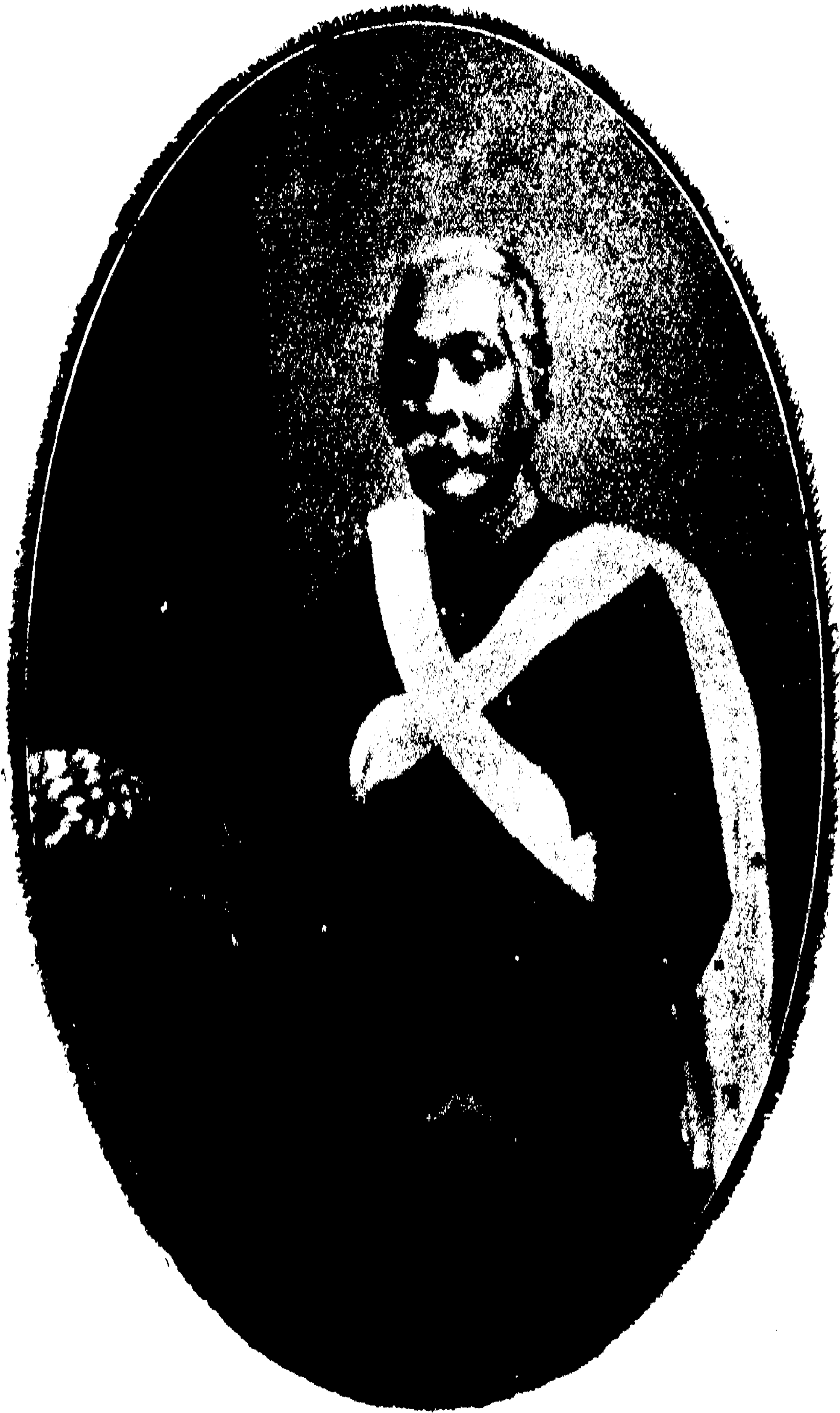
স্বর্গীয় প্যারীচাঁদ মিত্র ।