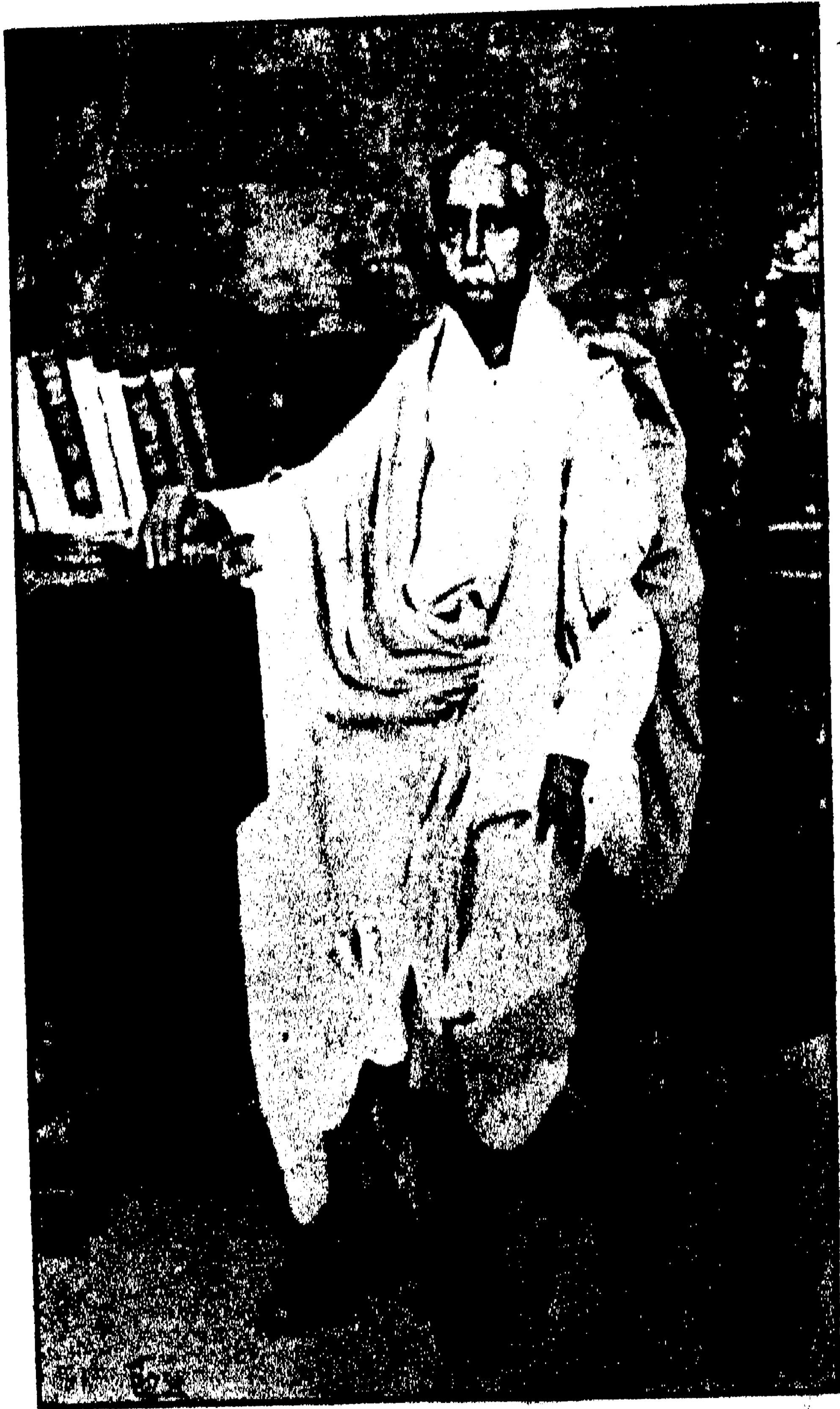
স্বর্গীয় উমেশচন্দ্র দত্ত ।