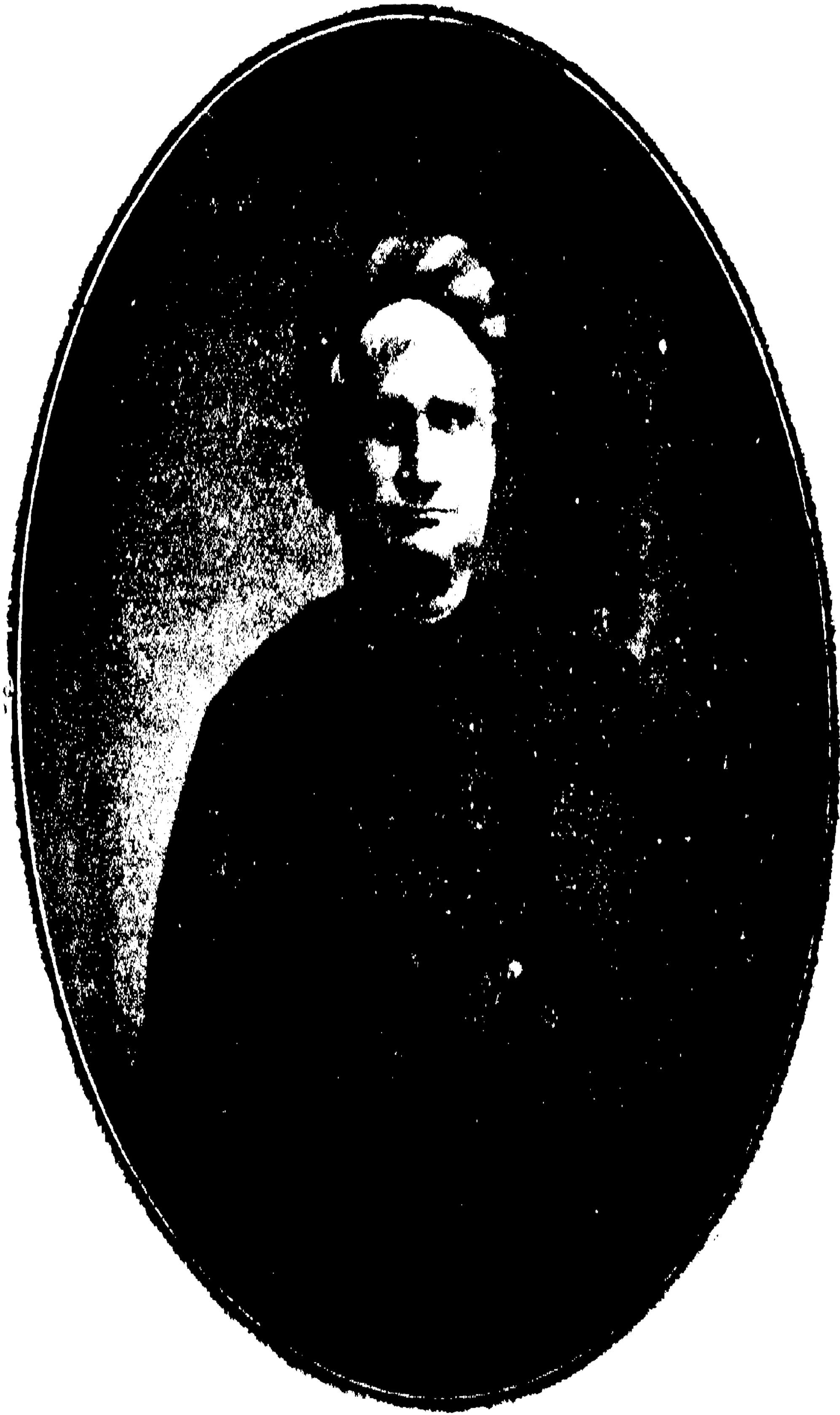
স্বর্গীয় বঙ্কিমচন্দ্র চট্টোপাধ্যায়