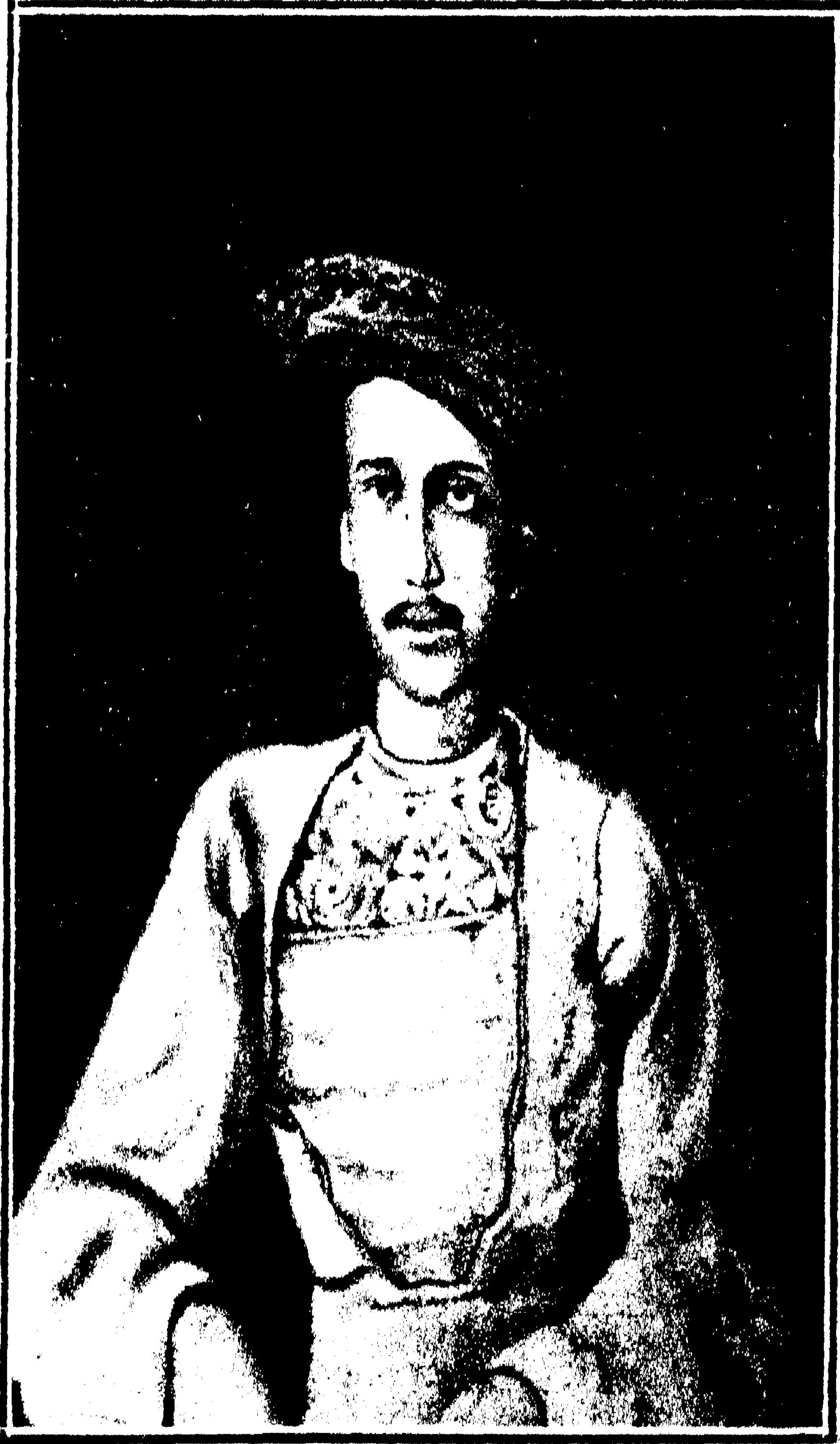
স্বর্গীয় দেবেন্দ্রনাথ ঠাকুর ( ১৮ বৎসর বয়সে ) ।