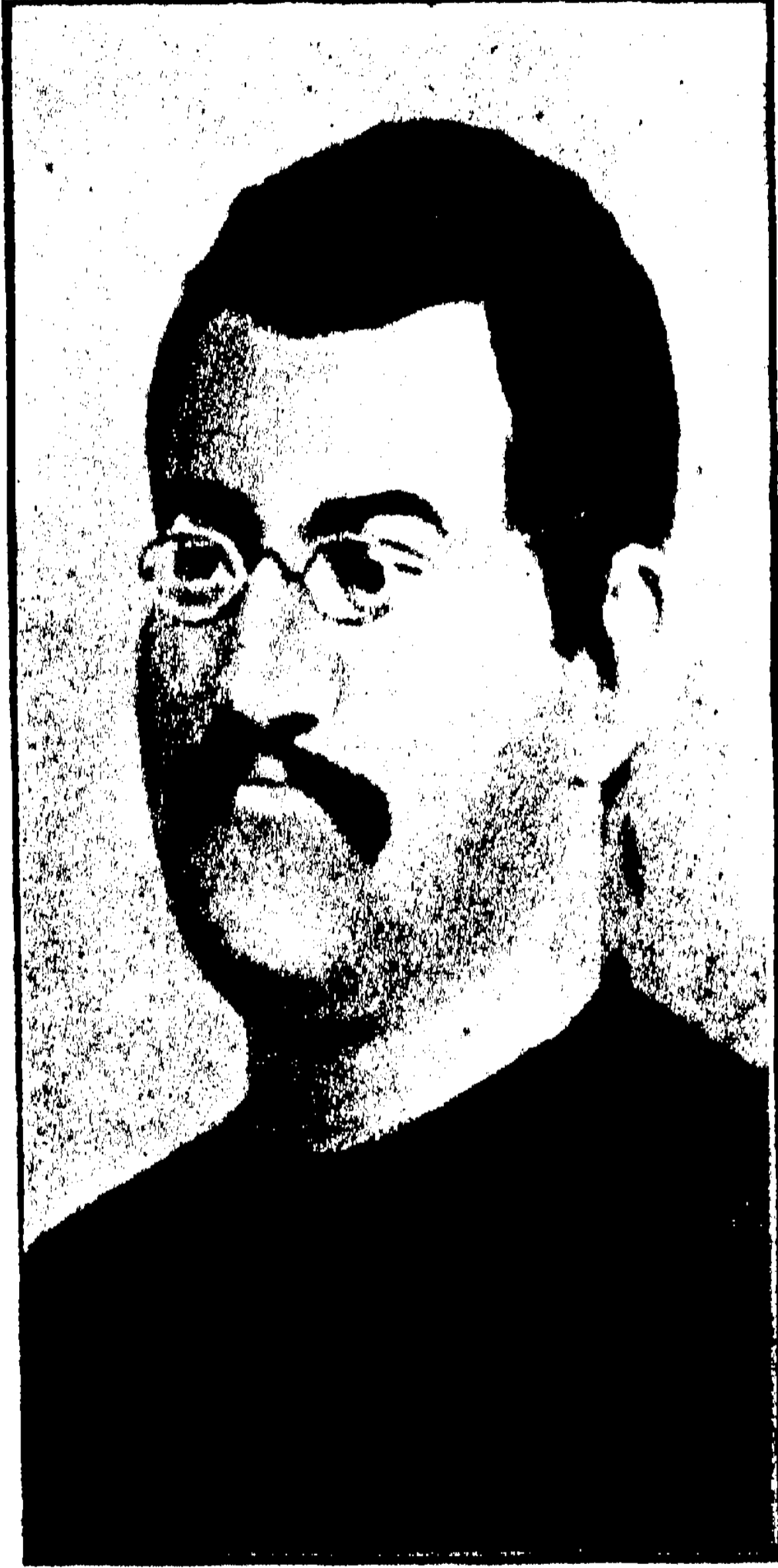
স্বর্গীয় কেশবচন্দ্র সেন ।