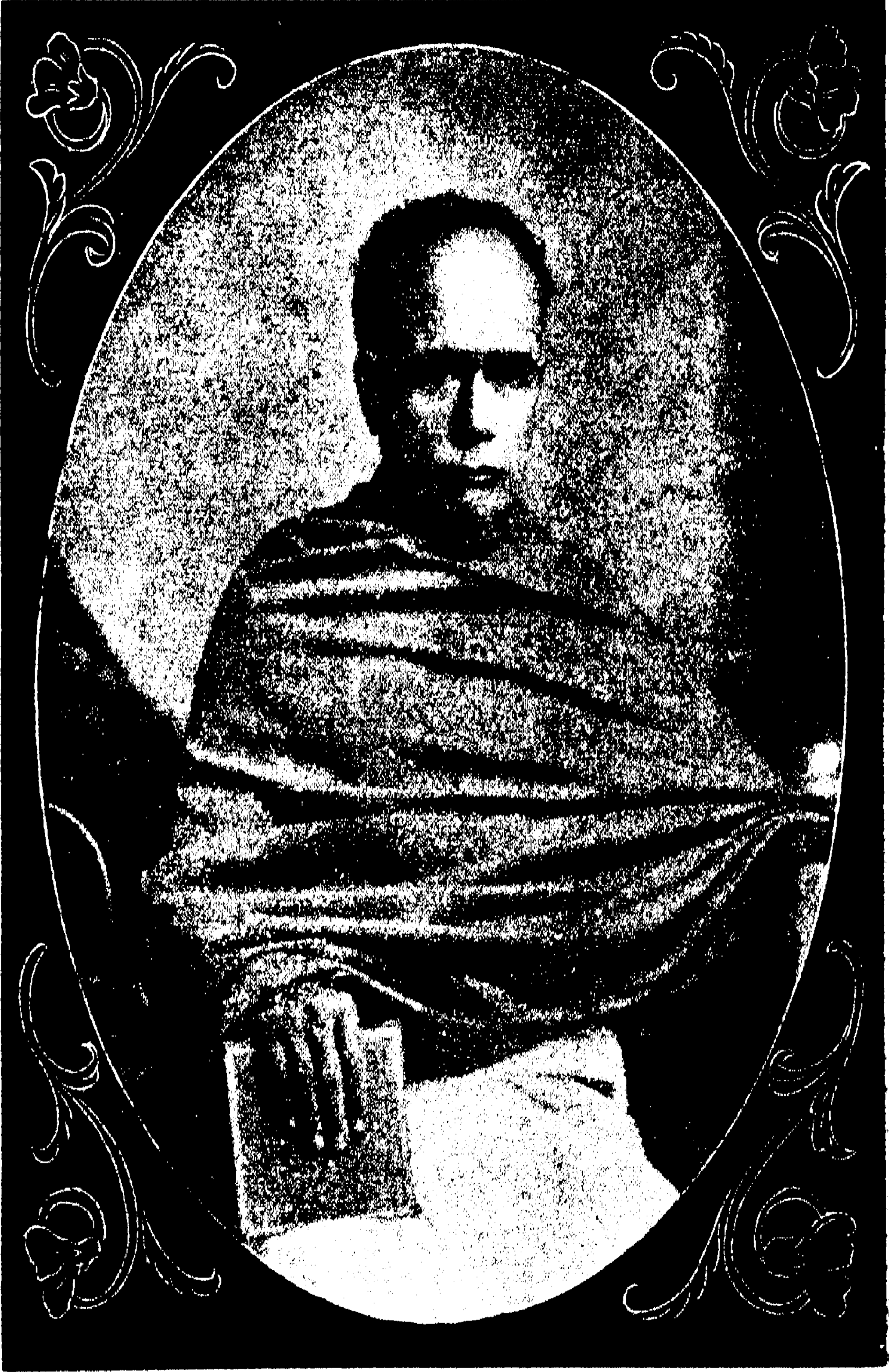
স্বর্গীয় ঈশ্বরচন্দ্র বিদ্যাসাগর