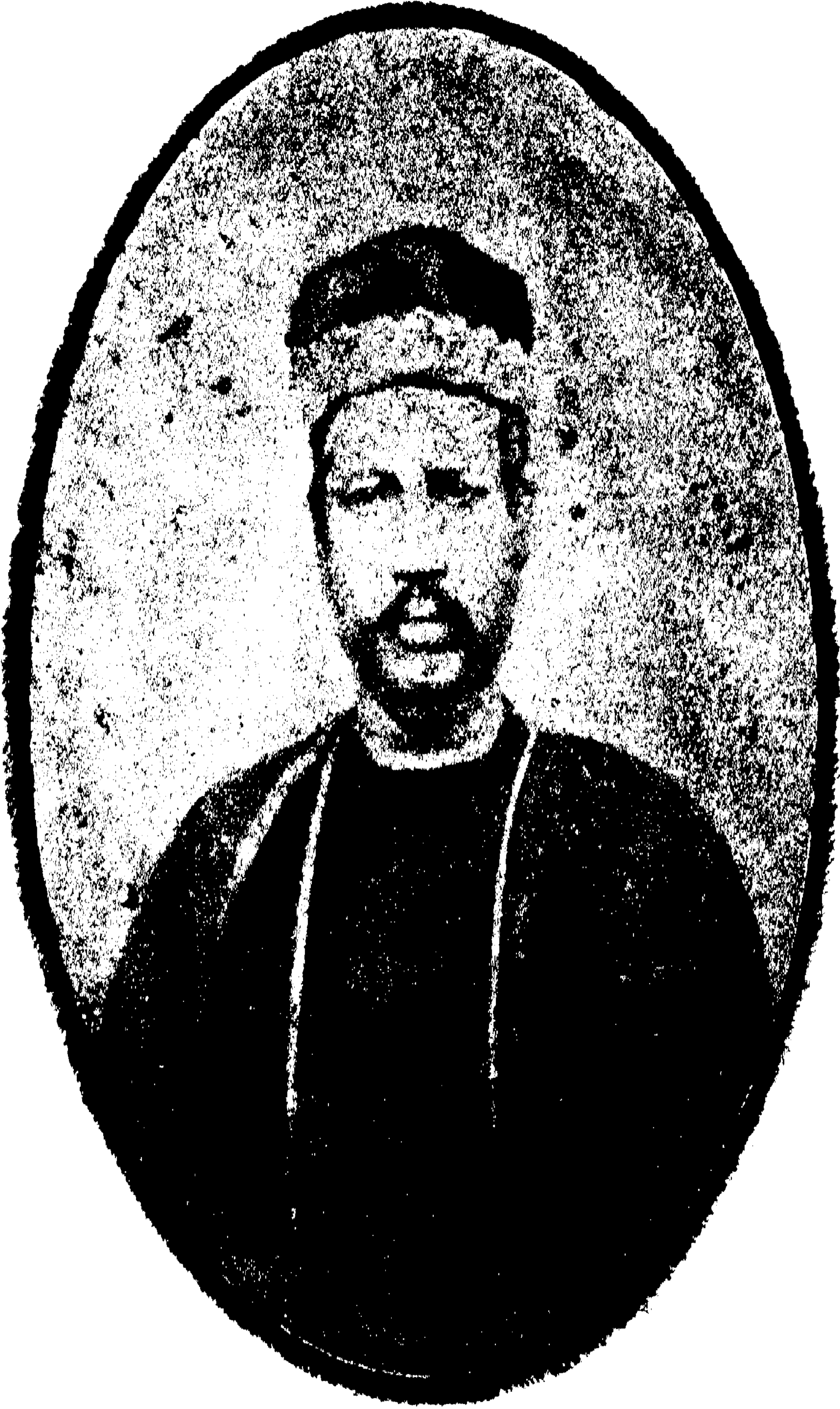
স্বর্গীয় দানবন্ধু মিত্র