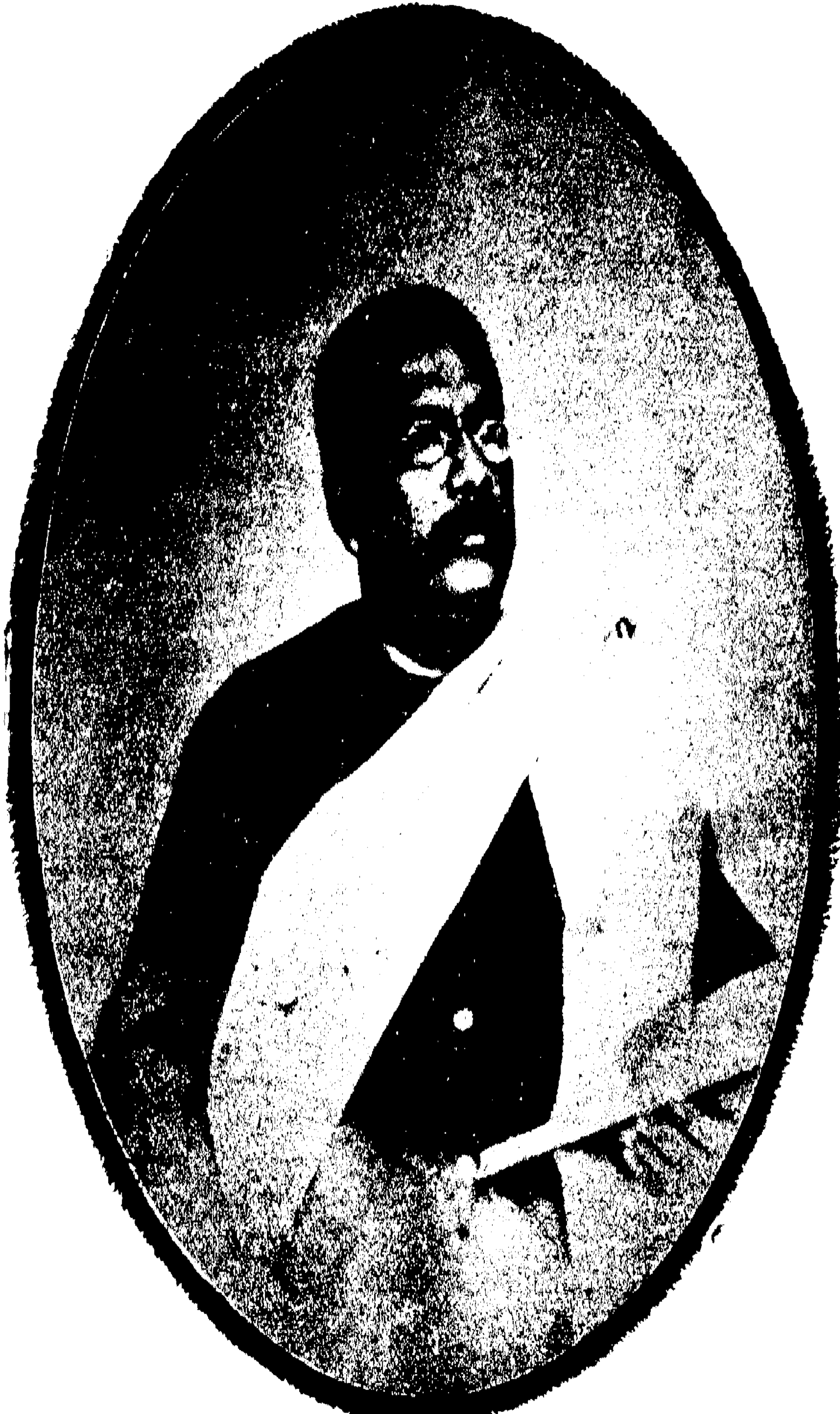
স্বর্গীয় কালীপ্রসন্ন ঘোষ