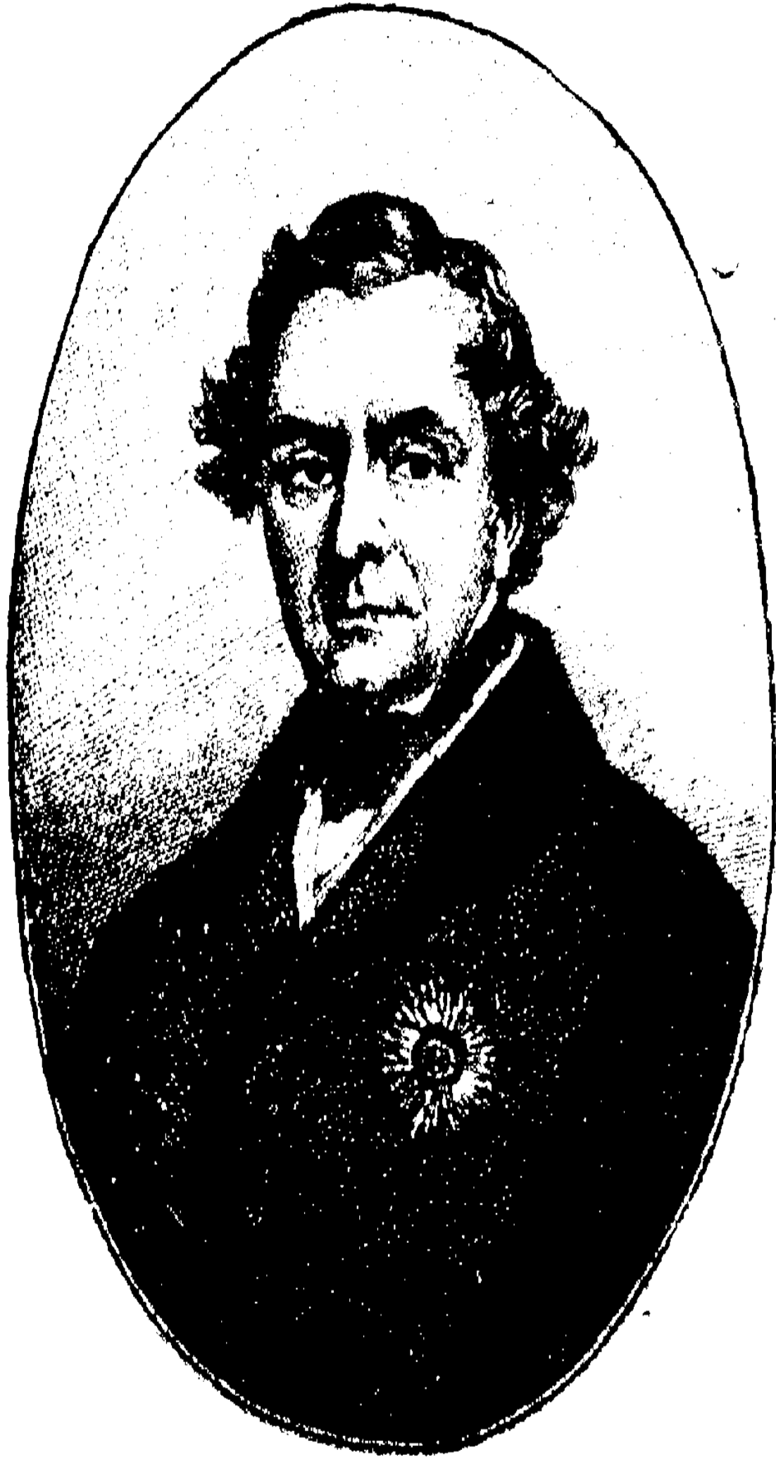
লর্ড হার্ডিঞ্জ ।