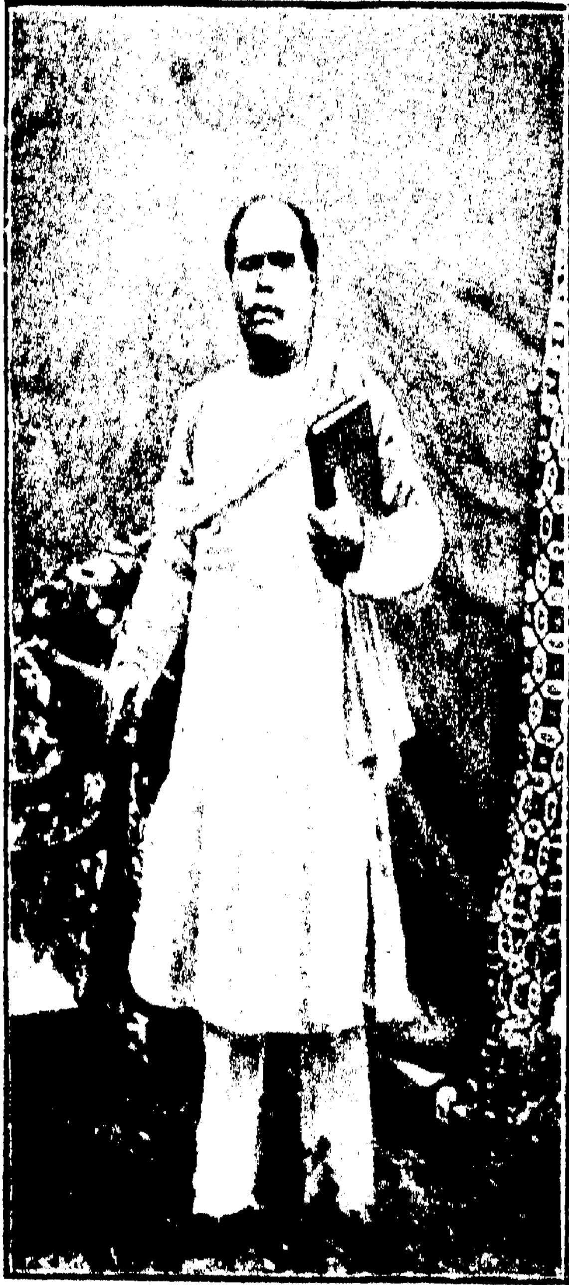
স্বর্গীয় প্যারীচরণ সরকার ।