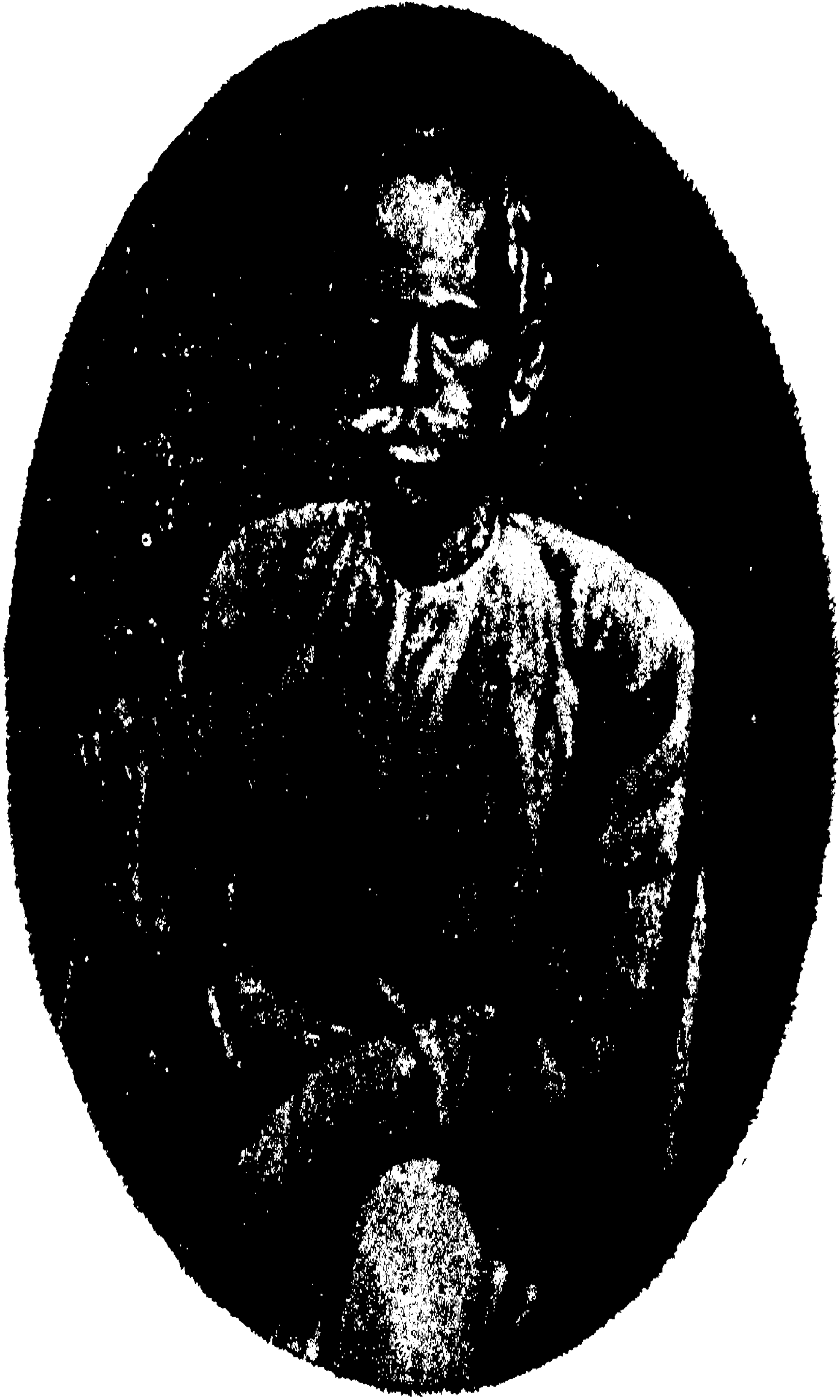
স্বর্গীয় অক্ষয়কুমার দত্ত ।