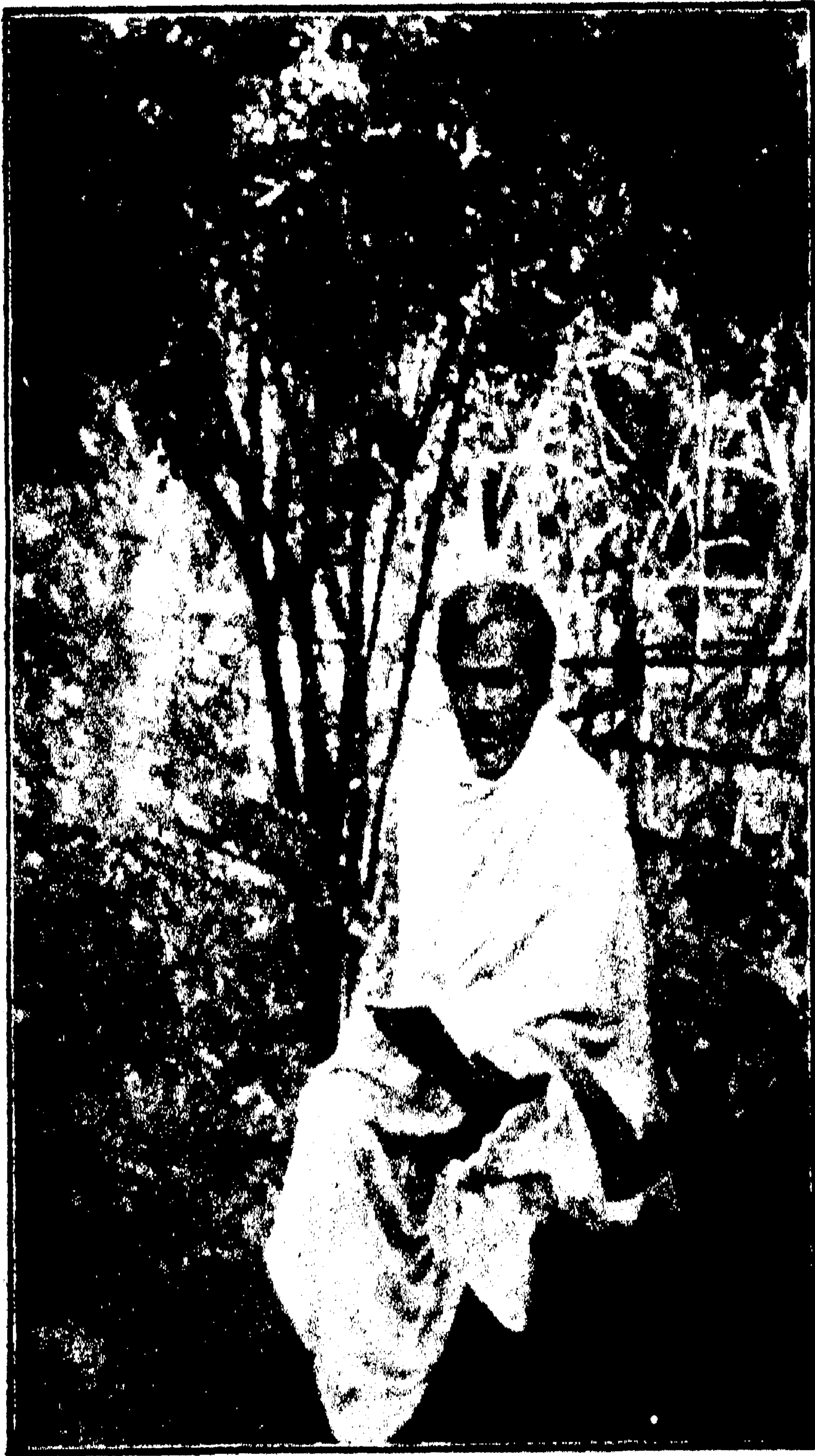
স্বর্গীয় কবি কৃষ্ণচন্দ্র মজুমদার