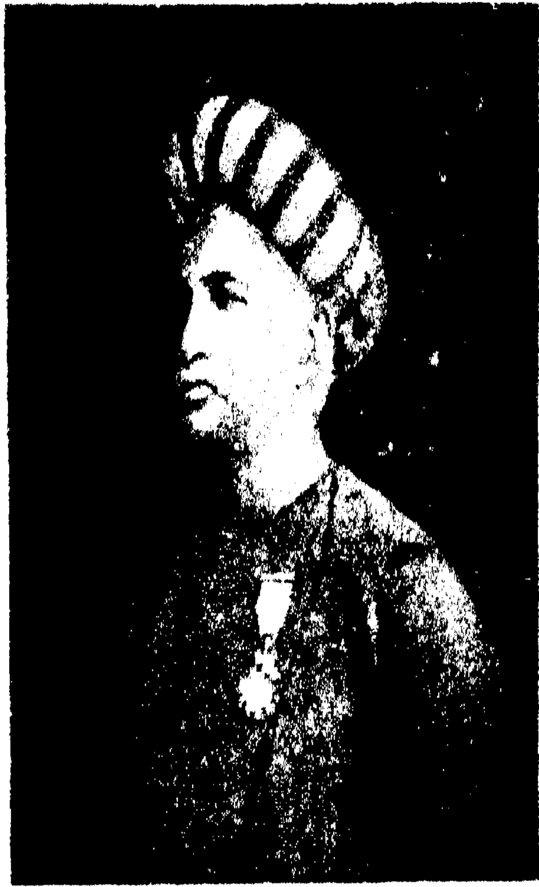
স্বর্গীয় রাজা রাজেন্দ্রলাল মিত্র ।