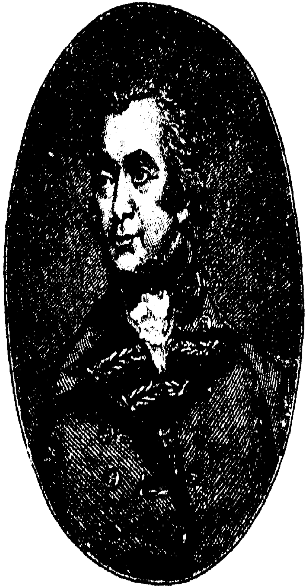
লর্ড হেস্টিংস ।