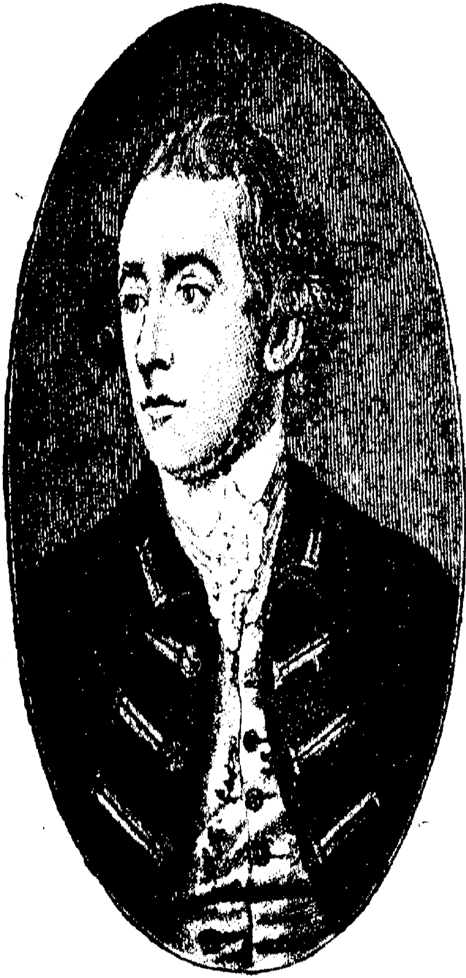
ওয়ারেন্ হেষ্টিংস ।