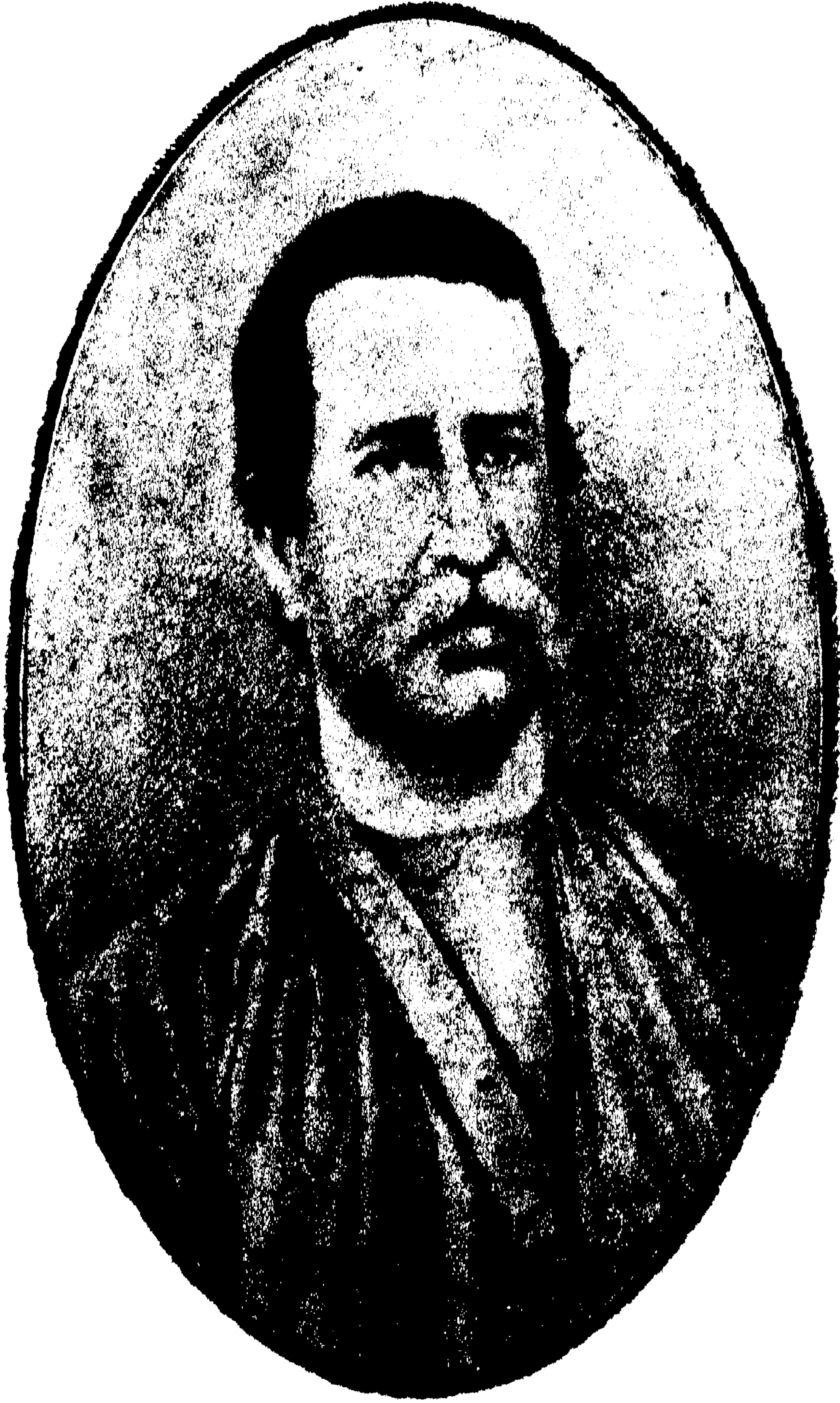
স্বর্গীয় ভূদেব মুখোপাধ্যায়