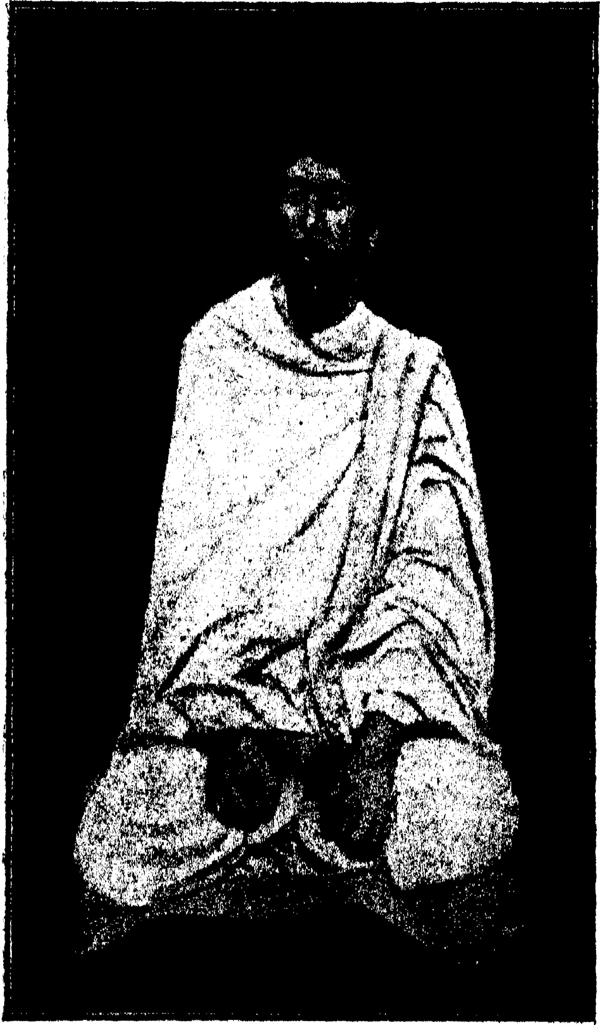
स्वर्गीय हरिनाथ मजूमदार ।