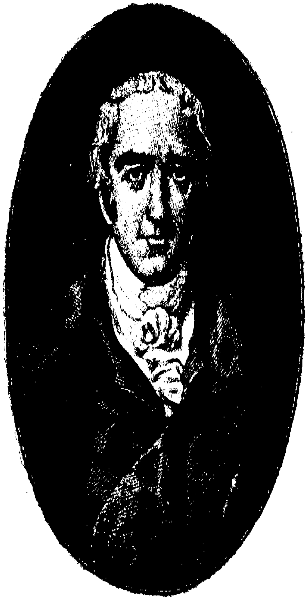
লর্ড ওয়েলেসলি ।