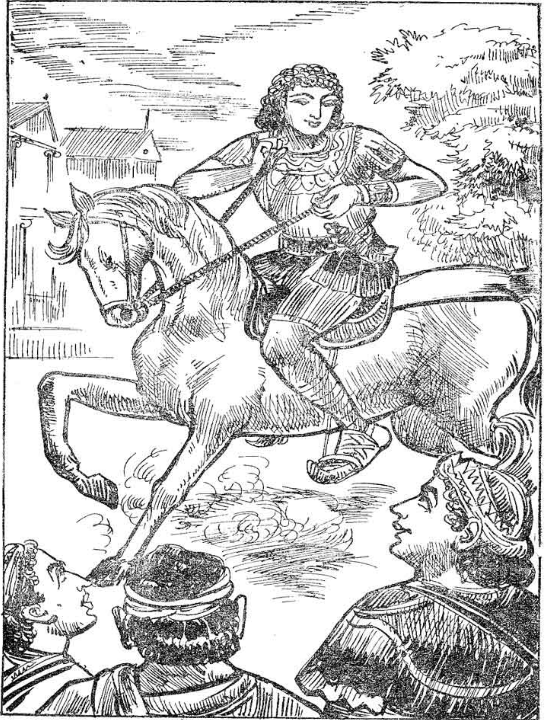
அலெக்சாந்தர் குதிரையை அடக்குதல்