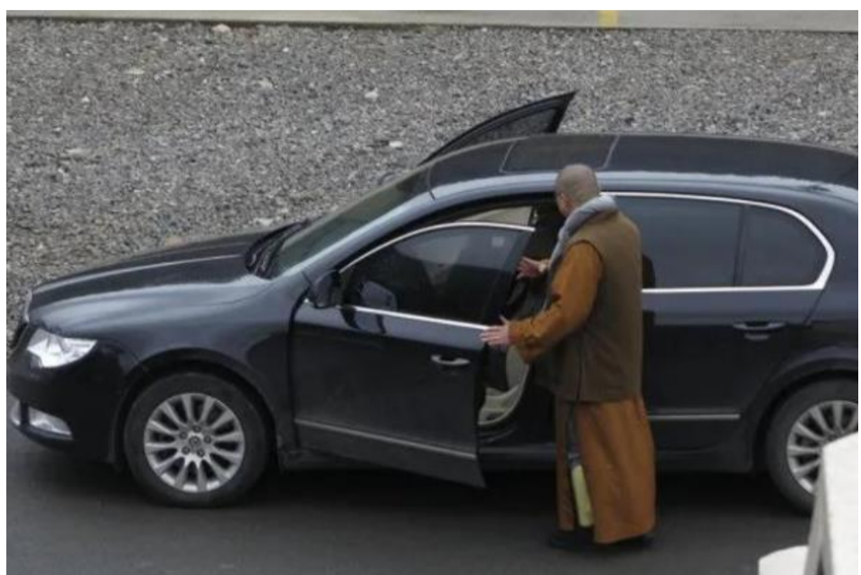
中国大陆的所谓和尚住持开豪车已经见怪不怪。

有网友盘点寺庙住持的座驾，指杭州灵隐寺住持开的是法拉利，价值 340 万人民币；少林寺住持释永信开的是大众，价值 150 万。