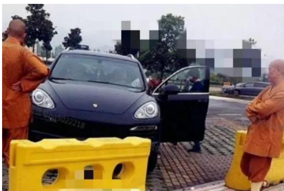
中国大陆的所谓和尚住持开豪车已经见怪不怪。