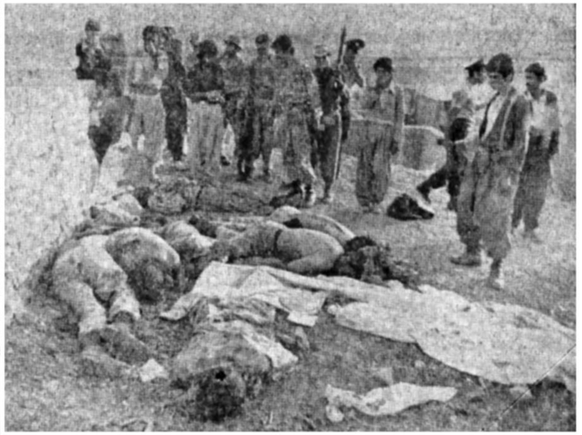
آوخ برادر شمریدم شهیدشدن، امامتسلیم شدن، درهناهم جنگیدن و پهلو به پهلو شهید شدن. آوخ برادرم! خدا بکشد آن حناکاری، که موراوی بگریزند و شریف رابه خاک انداخت.