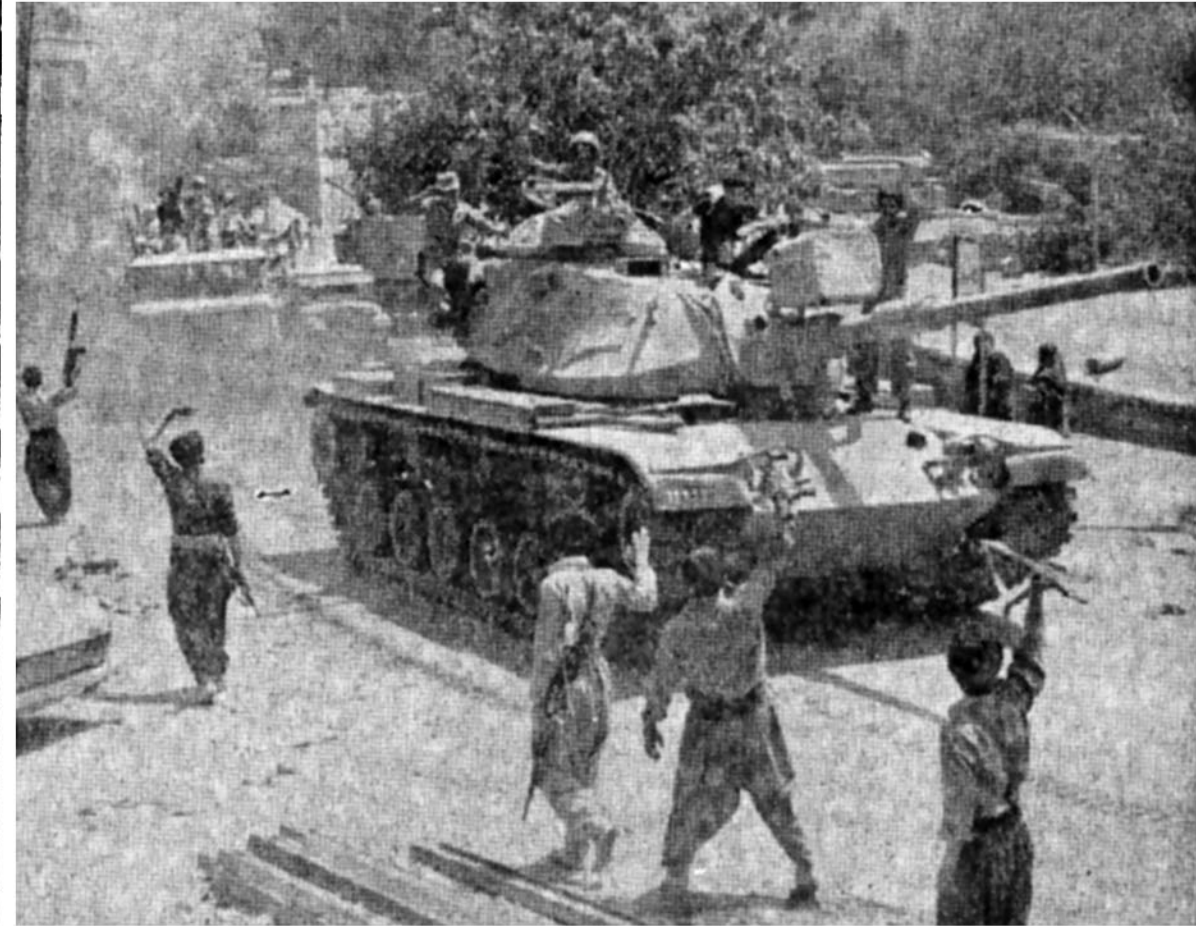
خوش آمدی برادر ارتشی ارتش وارد شهر جنگ زده پاوه میشود. جنگجویان خسته شهرکامراده در برابر خصم مقاومت کرده اند فریاد می زنند: خوش آمدی برادر ارتشی