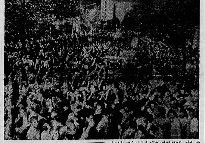
خیل عظیمی از مردم تهران، چغاز به پاسداران شهید را در برابر پوشش قانوی بر سر دست گرفته اند و با فریادهای خشک کننده و عده انتقاعی می دهند