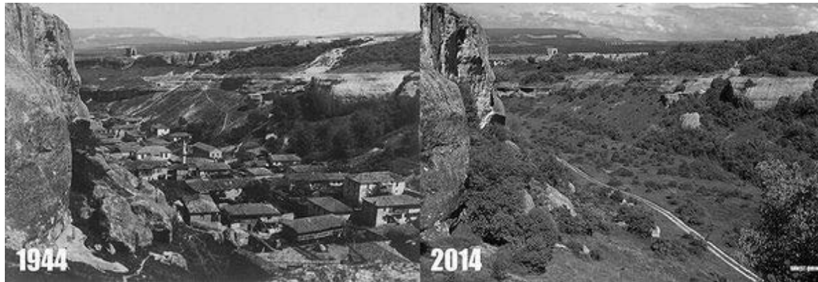
Черкез-Керман. 1944 і 2014 рр.