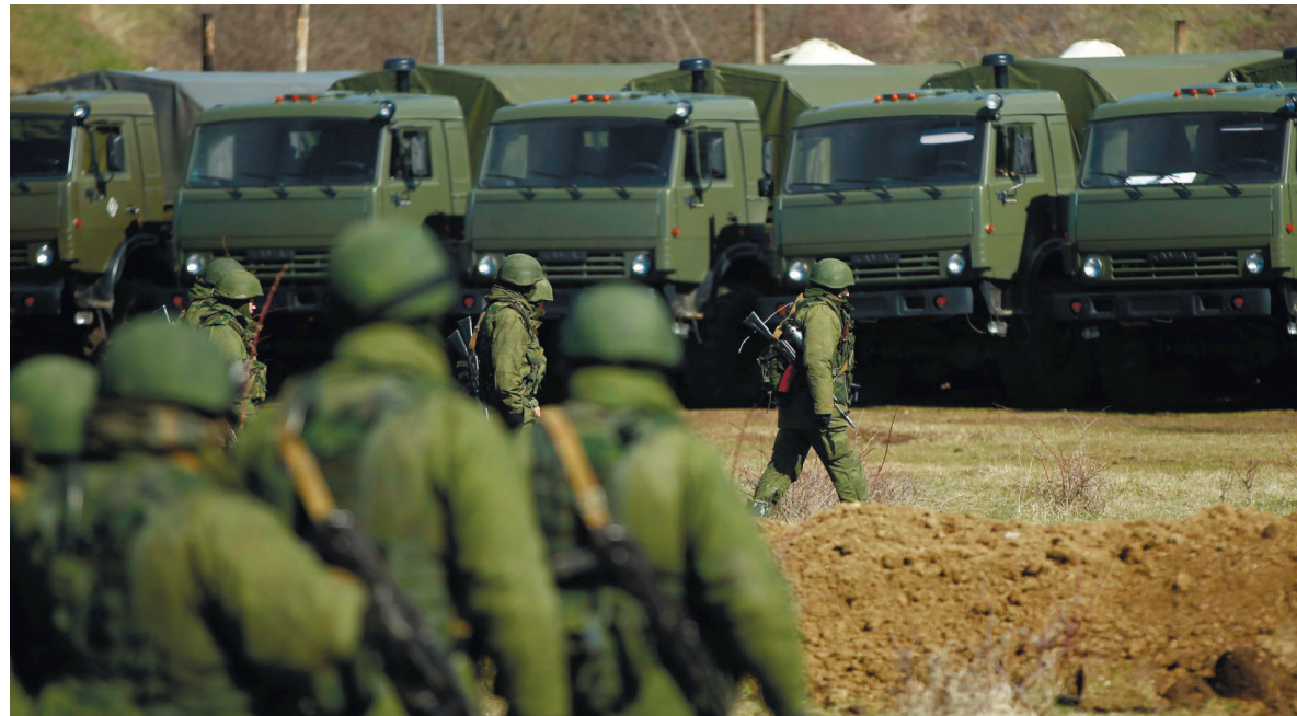
Біла військової частини у Перевальному, березень 2014 р.

зицію окупантів – вступити на військову службу в російську армію. Тим, хто бажає продовжити службу в ЗС України, буде надана можливість виїзду з Криму – окупанти навіть транспорт нададуть. Третім варіантом була можливість взагалі звільнитися – комбриг обіцяв контрактників звільнити своїм наказом; з офіцерами складніше, їх міг звільнити лише командувач.