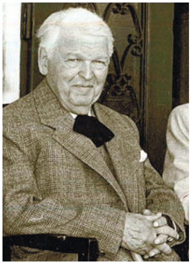
ФОТО З ВІКІПЕДИЇ (ДЖЕРЕЛ)

ЄВРОПЕЙЦІ ДОБРЕ ЗНАЮТЬ, ДЕ РОЗТАШОВАНИЙ КРИМ: СЕВАСТОПОЛЬ, БАЛАКЛАВА, АЛЬМА ТОЩО УВІЙШЛИ НЕ ЛИШЕ ДО ЇХНЬОЇ ІСТОРІЇ, А Й НАВІТЬ ДО МІСЬКОЇ ТОПОНІМІКИ. КРИМ УВІЙШОВ ДО АМЕРИКАНСЬКОЇ ТА ЄВРОПЕЙСЬКОЇ ЛІТЕРАТУР, ЗОКРЕМА РУМУНСЬКОЇ, АЛЕ МИ ДУЖЕ МАЛО, НА ЖАЛЬ, ЗНАЄМО ПРО ЛІТЕРАТУРУ НАШИХ СУСІДІВ.