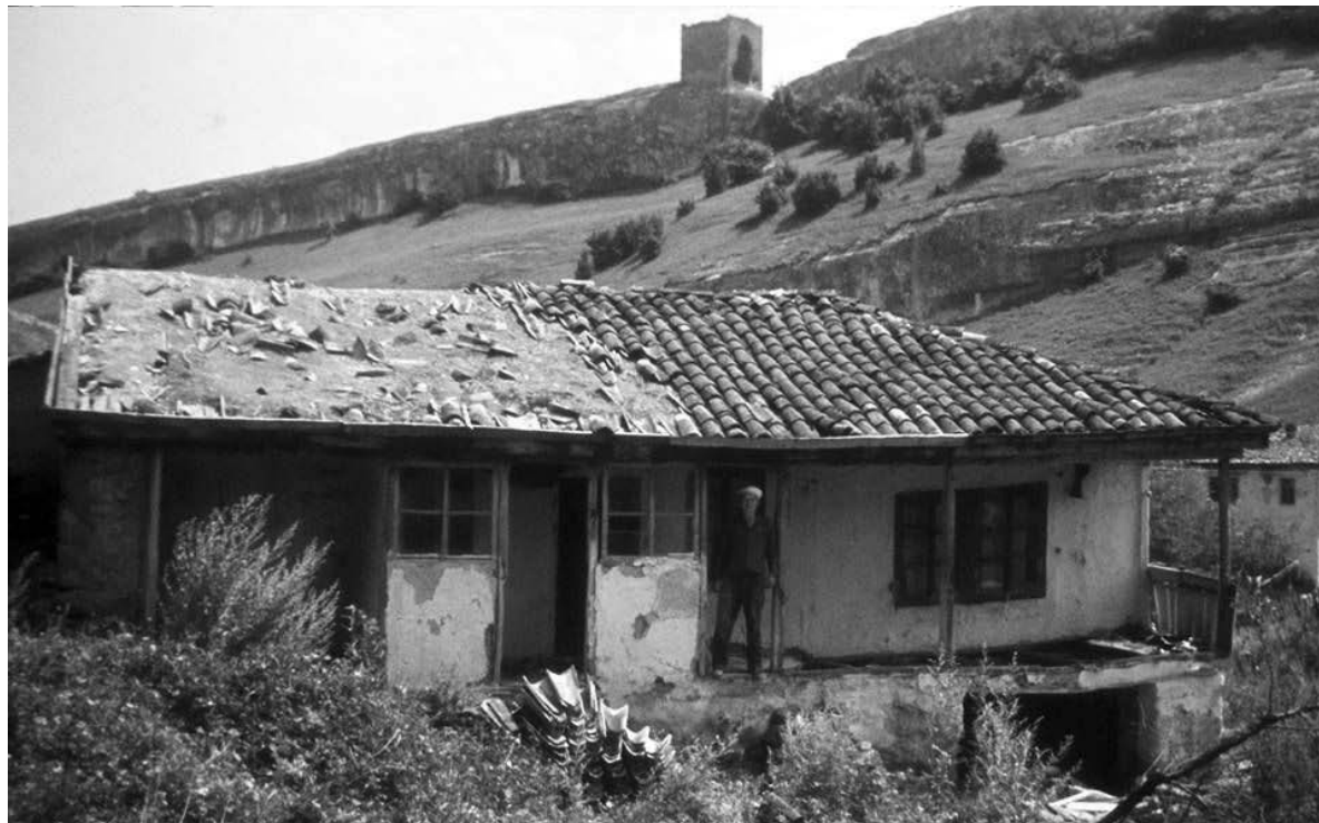
Останні будинки Черкез-Кермана (1969-й рік)