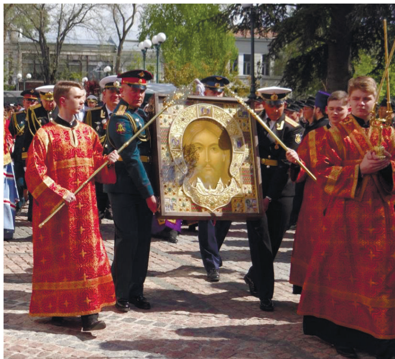
Ікону вносять до Олександро-Невського собору в Сімферополі

9 5-метрова культова споруда, котра має стати третьою за висотою серед православних храмів світу, буде духовним, навчально-методичним і просвітницьким центром для військовослужбовців, священників і цивільних осіб. Тим часом російські ЗМІ називають створення згаданого храму «яскравим прикладом продовження традиції спорудження на Русі військових православних храмів, які уосо-