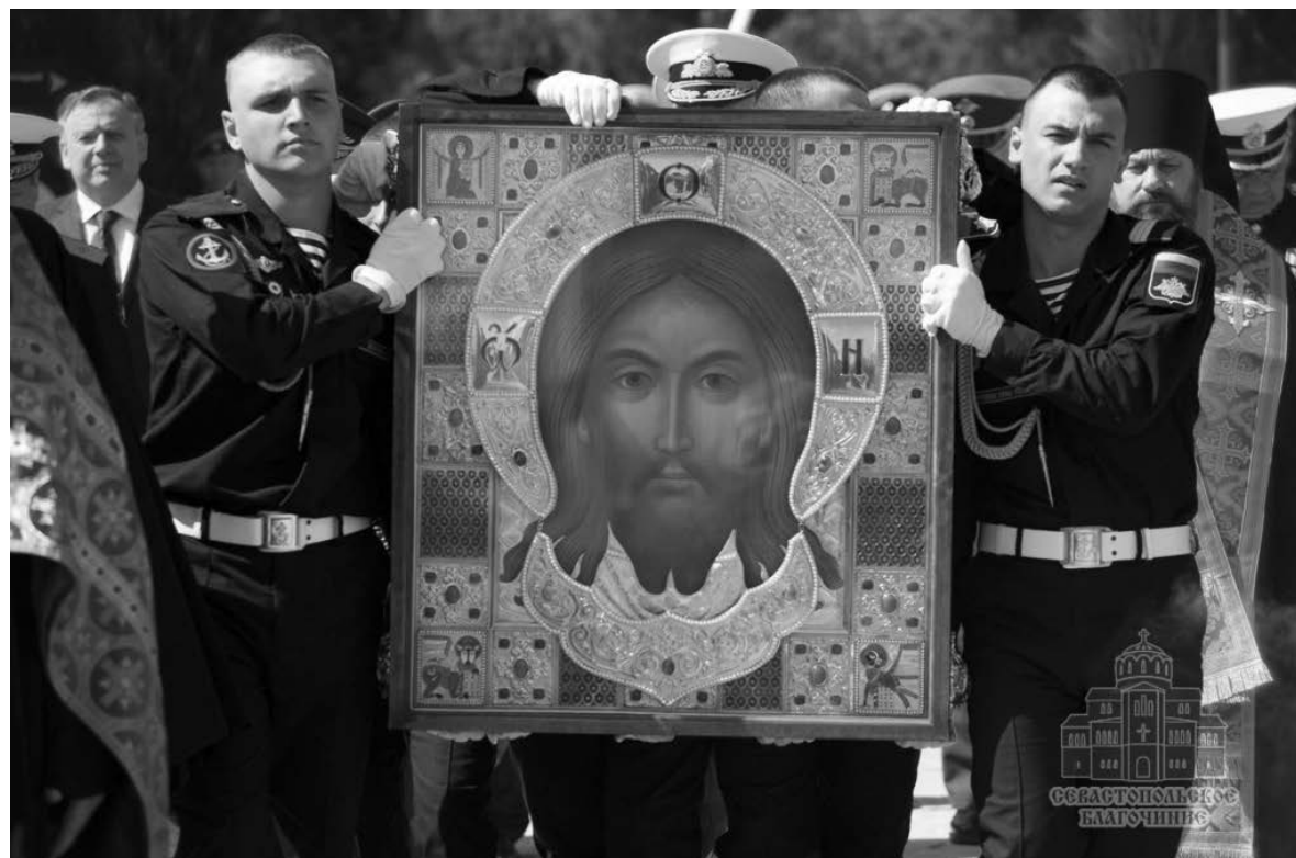
«Військовий Спас» у Свято-Володимирському соборі на території музею-заповідника «Херсонес Таврійський» у Севастополі

Не лишився осторонь і кримський митрополит УПЦ МП Лазар, який виступив після подячного молебню з такими не-