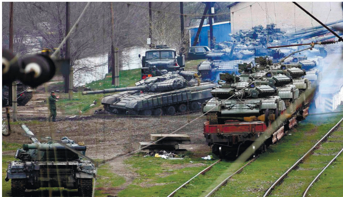
Завантаження танків на станції Джанкой для відправлення в Україну

Також на одній із нарад з офіцерами він озвучив вимогу росіян здати зброю, а також пропо-