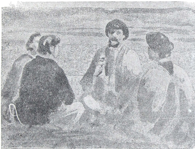
Martin Fierro dando consejos á sus hijos.

Ni el miedo ni la codicia Es bueno que á uno lo asalten— Ansi no se sobresalten Por los bienes que perezcan— Al rico nunca le ofrezcan Y al pobre jamás le falten. Bien lo pasa hasta entre Pampas El que respeta á la gente— El hombre ha de ser prudente Para librarse de enojos— Cauteloso entre los flojos Moderados entre valientes. El trabajar es la ley Porque es preciso alquirit—