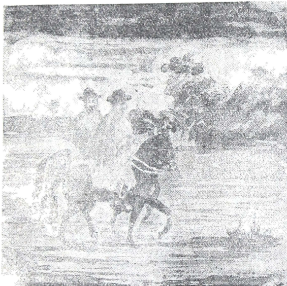
Martin Fierro y su amigo Cruz.

En mil cosas cavilaba Y á una güelta repentina Se me hacia ver á mí china O escuchar que me llamaba.