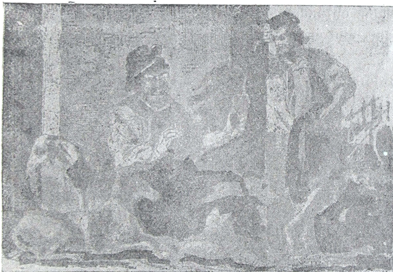
El viejo Vizcacha dando sus consejos.

« Las armas son necesarias Pero naides sabe cuando; Ansina si andás pasiando, Y de noche sobre todo, Debés llevarlo de modo Que al salir, salga cortando. » « Los que no saben guardar Son pobres aunque trabajen— Nunca por mas que se atajen Se librarán del cimbrón,— Al que nace barrigón Es al ñudo que lo fagen. » « Donde los vientos me llevan Allí estoy como en mi centro, Cuando una tristeza encuentro Tomo un trago pa alegrarme,