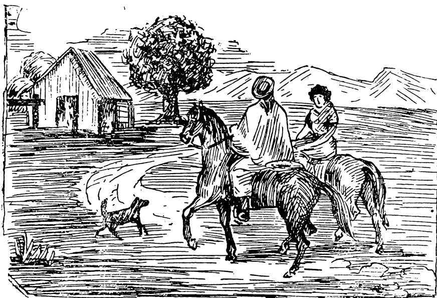
La vuelta de Martin Fierro.

En notando nuestra ausiencia Nos habian de perseguir— Y al decidirme á venir, Con todo mi corazón Hice la resolucíon De peliar hasta morir. Es un pelígro muy serio Cruzar juyendo el desierto— Muchísimos de hambre han muerto Pues en tal desasosiego, No se puede ni hacer fuego Para no ser descubierto.— Sólo el arbitrio del hombre Puede ayudarlo á salvar—