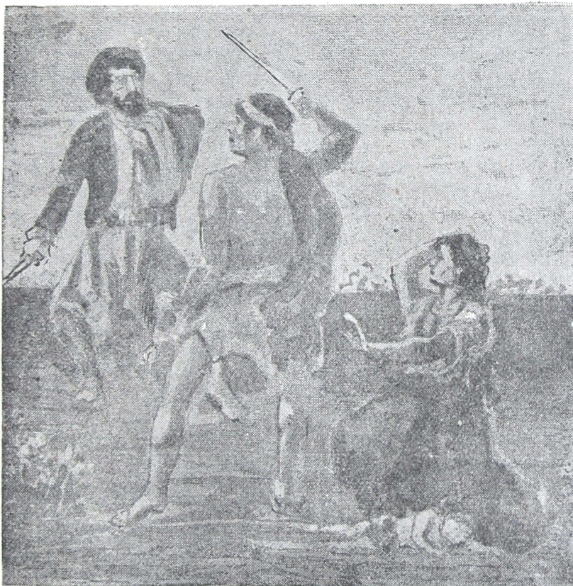
Pelca de Martín Fierro con un indio.

Tres figuras imponentes Formábamos aquel terno— Ella en su dolor materno, Yo con la lengua dejuera, Y el salvaje como fiera Disparada del infierno. Iba conociendo el indio Que tocaban á degüello— Se le erizaba el cabello Y los ojos revolvió— Los labios se le perdian Cuando iba á tomar resuello.