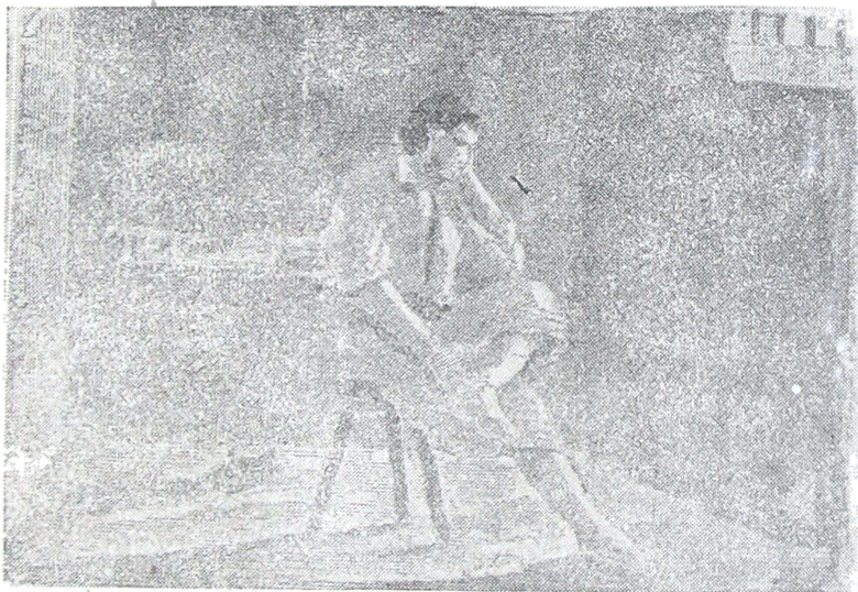
En la Penitenciaría.

No es en grillos ni en cadenas En lo que usté penará, Sinó en una soledá Y un silencio tan projundo, Que parece que en el mundo Es el único que está. El mas altivo varón Y de cormillo gastao, Allí se veria agoviao Y su corazón marchito Al encontrarse encerrao A solas con su delito. En esa carcel no hay toros, Allí todos son corredores; No puede el mas altanero Al verse entre aquellas rejas.